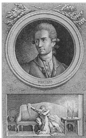
Abb. 13: Werther, Kupferstich von Daniel Berger nach Nikolaus Daniel Chodowiecki, 1775 (Ex. Goethe-Museum, Düsseldorf)

Illustriert wird folgende Textstelle: 159