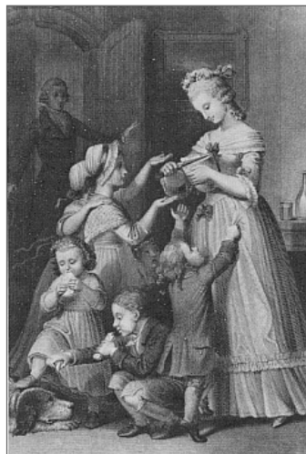
Abb. 5: Photographie im Schmuckrahmen, nach dem Carton von Wilhelm Kaulbach, 1859 62 (Ex. UB München; Abb. ohne Schmuckrahmen)