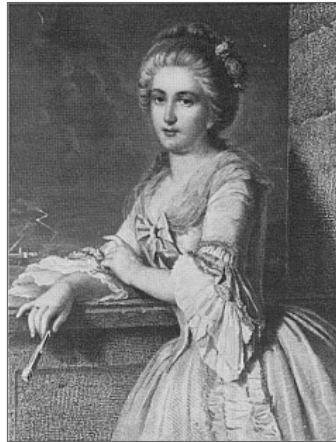
Abb. 11: Lotte, Stahlstich von Conrad Geyer nach Friedrich Pecht, 1864 134 (Ex. Privatbesitz)

Illustriert wird folgende Textstelle 135: