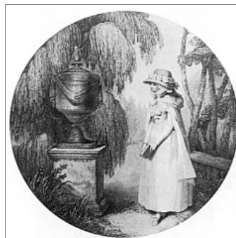
Abb. 16: Kupferstich nach John Raphael Smith's Großgraphik von 1783 183 (Ex. Goethe-Museum, Düsseldorf)