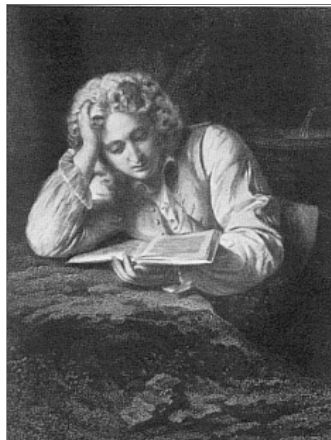
Abb. 10: Werther, Stahlstich von Lazarus G. Sichling nach Friedrich Pecht, 1864 116 (Ex. Privatbesitz)

Illustriert werden folgende, von Pecht kombinierte Textstellen: 117