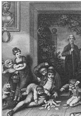
Abb. 6: Kupferstich von Leopold Beyer nach der Zeichnung von Heinrich Ramberg, 1831 80 (Ex. Bayer. Staatsbibliothek München)

»Dem Zug der Zeit nach kleinbürgerlicher Idylle folgend, hat Ramberg das Motiv neu in die Illustration aufgenommen.« 81 Von August Böttiger stammt die dem Kupfer beigegebene Bilderklärung 82: