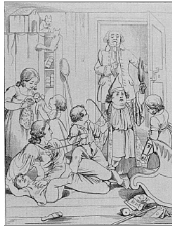
Abb. 7: Stahlstich von Julius Nisle, 1840 (vgl. Abb. 2)

In Nisles sehr biedermeierlicher Darstellung 89 erfährt dieses Motiv eine humoristische Ausschmückung. Werther liegt auf dem Boden eines mit sechs Kindern, Eichhörnchen und vielerlei Spielzeug angefüllten Zimmers. Er »küzelt« gerade das Kleinste, während ein Bub auf ihm reitet; wie das kleine Mädchen rechts blicken beide amüsiert auf den Bruder, der sich mit Zipfelmütze und Morgenrock als >Philister<, verkleidet hat und mit einer Rute droht. Hinter ihm 90 öffnet eben der Doktor die Türe 91 und sieht indigniert auf sein Zerrbild en miniature. Die zwei Mädchen hinter Werther sind so in ihr Puppenspiel vertieft, daß sie nichts von allem bemerken.