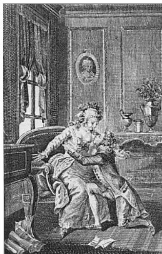
Abb. 14: Werther! cria-t-elle d'une voix étouffée. – Kupferstich von Francois Marie Isodore Quéverdo, 1793 171 (Ex. Freies Deutsches Hochstift, Frankfurt/M.)

Illustriert wird folgende Textstelle: 172