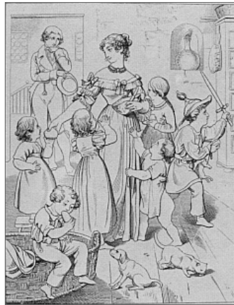
Abb. 2: Brotschneideszene / Erste Begegnung – Umrißstich von Julius Nisle. Illustration Nummer II von 12 Stahlstichen zum Werther , 1840 52 (Ex. Gutenberg-Museum, Mainz)

Wir sehen in den sparsam möblierten, weiten Vorsaal: Schrank, Glasballon, 53 Wäschekorb und Schemel deuten die tätige Nutzung des Raumes an, der sich rückwärts türlos zum Treppenhaus öffnet. In der Bildmitte steht, frontal zum Beschauer, die mädchenhafte Lotte im schleifengezierten schlichten Kleid, Brotlaib und Messer in der Linken; mit der Rechten reicht sie mit liebevollem Blick einer Kleinen ihre Scheibe Brot. Frisur und Halsschmuck wie auch die Haare und bequemen Kleider der sechs Geschwister sind biedermeierlich – die Art, wie sie die Schwester bittend umdrängen, ihre treuherzigen Blicke und Gesten, ihr Spiel und Essen mit Hündlein und Katze ebenfalls. 54