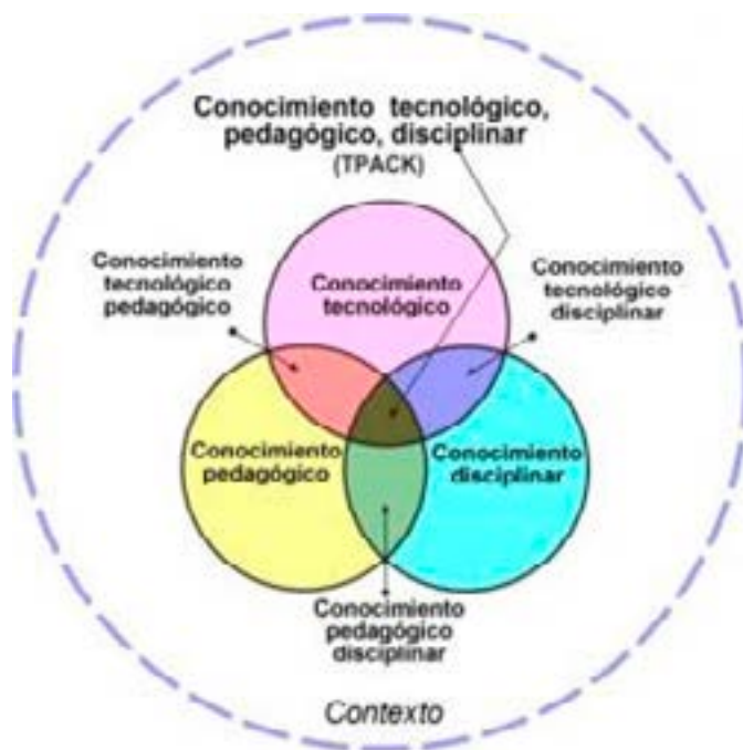
Figura 1. Modelo TPACK