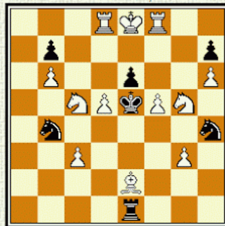
Mat 3. ťahom, 2 riešenia

I.-II. c.e.a. – Pravda 1994-1995 č. 2882, 10.11.1995 Miroslav Brada, Zvolen