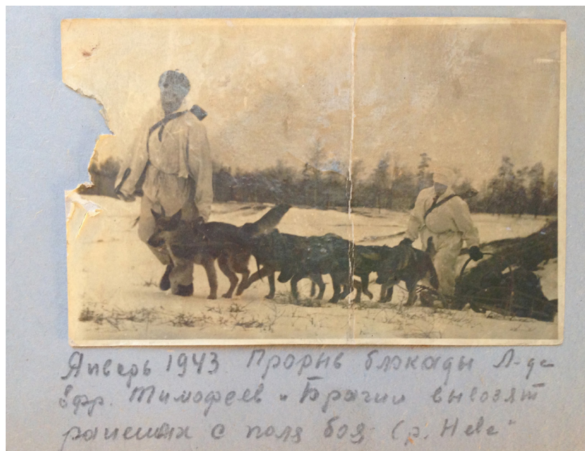
Рис. 5. Нартовая упряжка 34-ОИБМ на прорыве блокады.

в нартовой упряжке Ераниной вожаком была чистокровная немецкая овчарка по кличке Миг 1 .