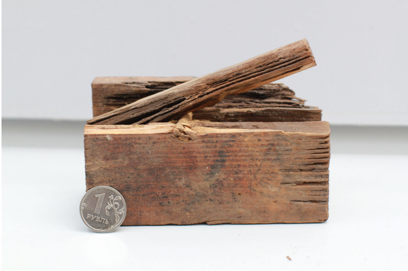
Рис. 7. Корпус деревянной противопехотной мины с участка Ленинградского фронта.