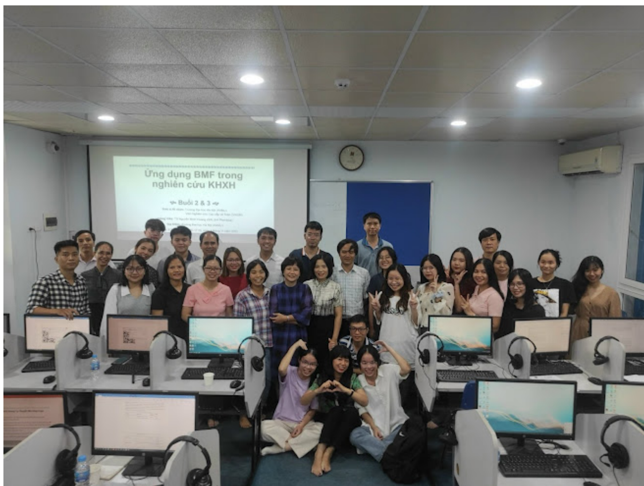
Hình 1: Lớp học BMF Analytics