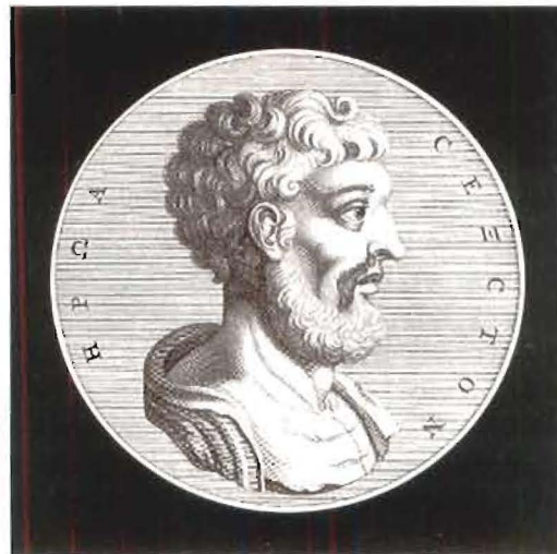
Sexto Empírico, médico e filósofo grego da segunda metade do século II e início do séc. III d.C. Sua obra descreve a escola cética que remonta a Pirro de Élis (c. 365-275 a.C.)

Os escritos de Sexto Empírico reapareceram na segunda metade do século 16. Primeiramente, numa tradução latina das Hipotiposes pirrônicas realizada por Henri Estienne, publicada em Paris em 1562. Logo em seguida, em 1569, numa tradução latina da obra Adversus mathematicos , realizada por Gentien Hervet. Foram esses textos que mais contribuíram para o surgimento do pensamento cético no início da filosofia moderna, em especial nos escritos de Montaigne (1533-1592). Tão forte foi a impressão causada pela leitura de Sexto que, além de retomar e desenvolver nos Ensaio s os principais argumentos da tradição cética