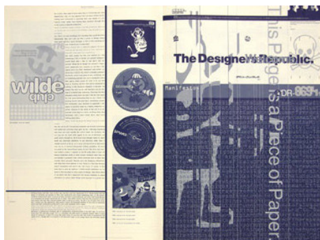
Ejemplo de páginas interiores y portadas de la revista Emigre .