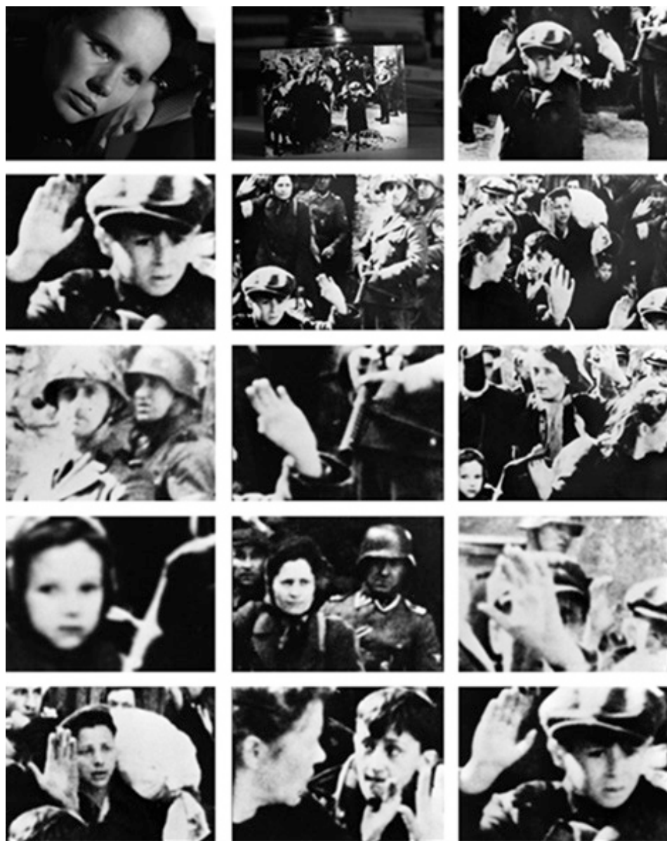
Figura 2. Fotogramas de la secuencia completa. I. Bergman (1966). Persona . min. 59.