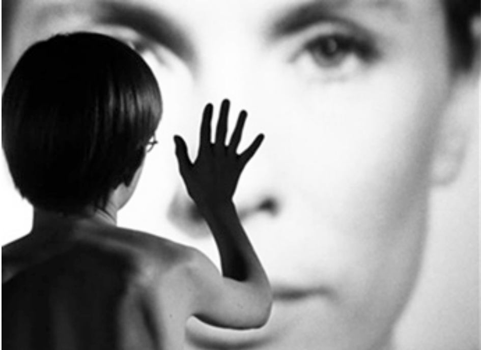
Figura 1. BERGMAN, I. (1966). Persona . min. 5 y 72.

el lugar de la pantalla, y, por consiguiente, de los rostros que se proyectan en ella [Figura 1]. Sobre esta escena, Susan Sontag sugiere que “la superficie que toca induce a pensar en una pantalla cinematográfica, pero también en un retrato y en un espejo” (2007: 169), lo 1], que implica, en cierta medida, una equivalencia conceptual y la identificación personal.