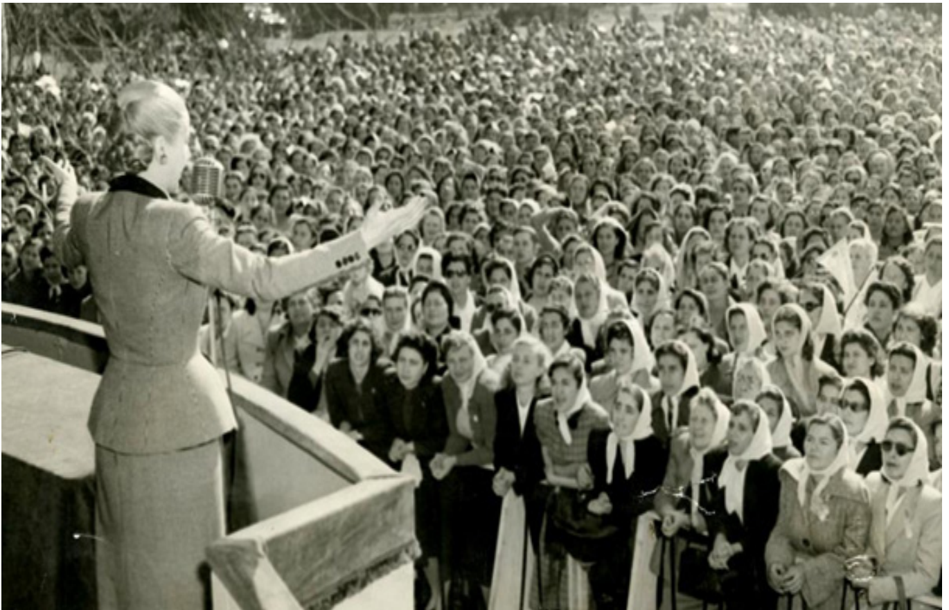
Imagem 2: Eva Perón e as peronistas de seu gênero (1951)