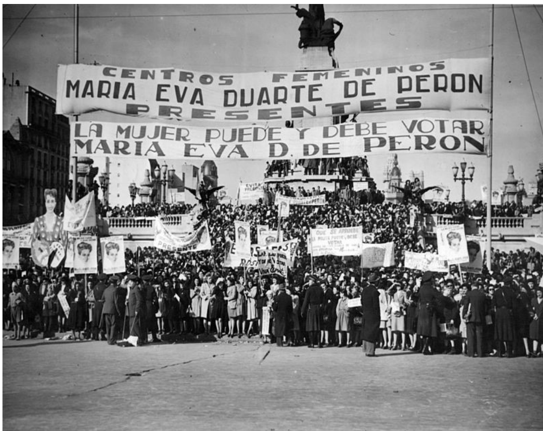
Imagem 4: Manifestação peronista em frente ao Congresso Nacional (1948)