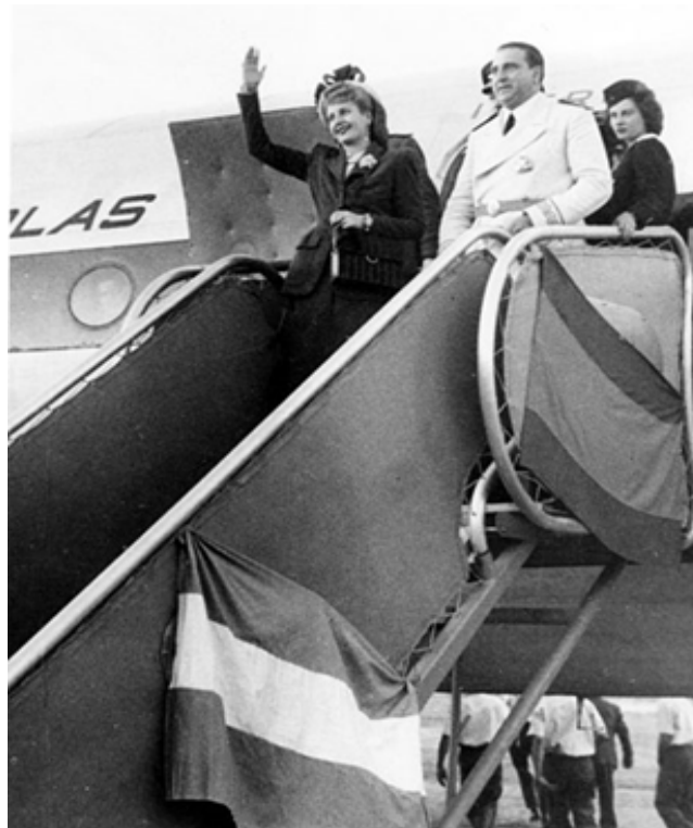
Imagem 1: Eva e Perón desembarcando na Espanha de Franco (Madri 1947)

Um dos principais êxitos do governo peronista foi, então, a integração das camadas sociais mais baixas. Essa conquista foi resultado das reformas sociais aplicadas por Perón, como por exemplo a orientação distributiva, que não cobriu apenas as camadas baixas, mas estendeu-se a todos os setores sociais e econômicos. Com a promoção da pequena e média indústria houve um maior nivelamento da riqueza da elite. O Estado tentou ao menos diminuir a lacuna entre a população