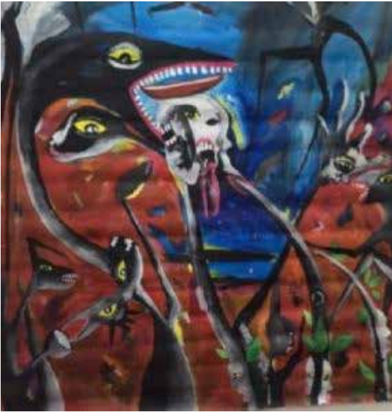
Ronald Cyrille, Sans titre, technique mixte, œuvre en cours de finition exposée à l'Habitation La Ramée, Guadeloupe, en février et mars 2018 (photo d'artiste).

rusé des contes antillais, dans une possible métaphore du conflit qui oppose le dominé au dominant, maître des terres, développe une patte vengeresse qui vient dévorer le « monstre-flore blanc ».