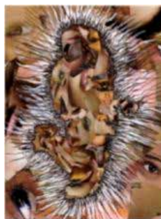
Mix 2009, coupures de presse, acrylique encre. Long : 53cm, épaisseur : 5cm

Semblable à cet autre organe qu'est le cœur, enfin dégagée des injonctions exogènes, l'île irradie à partir de son centre vers lequel les regards convergent. Les notions de centre et de périphérie sont ici mouvantes, voire réversibles. Pour l'artiste, le milieu insulaire n'est pas nécessairement