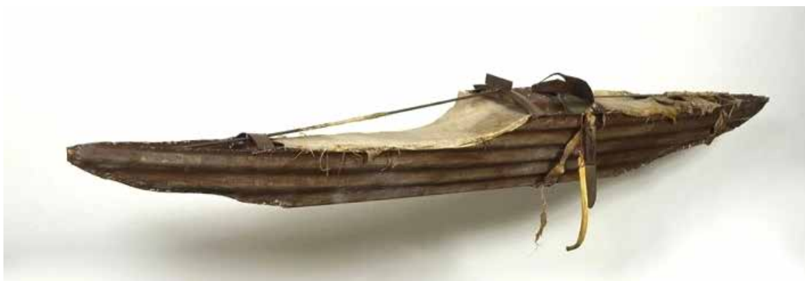
Rafael Ferrer, Kayak #2:Norte, 1973 Collection Museum of Contemporary Art, Chicago

Cette sculpture est un assemblage de plusieurs fragments hétéroclites : un morceau de pirogue creusée à même le bois d'un tronc de mahogany – l'espèce d'acajou endémique au bassin caribéen, de la tôle ondulée, de l'os, de la peau d'animal, un couteau, une corde, des cheveux, du bardage et de la peinture. Elle rappelle par sa forme composite et sa couleur bigarrée – on dit du mahogany qu'il fait partie des bois rouges – la force signifiante de la traversée, de la défamiliarisation nécessaire pour entamer la déprise d'un réel envoûté par le mirage néolibéral, descendant direct de la colonisation aux Amériques.