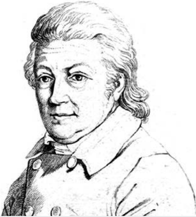
Samuel Thomas Soemmerring