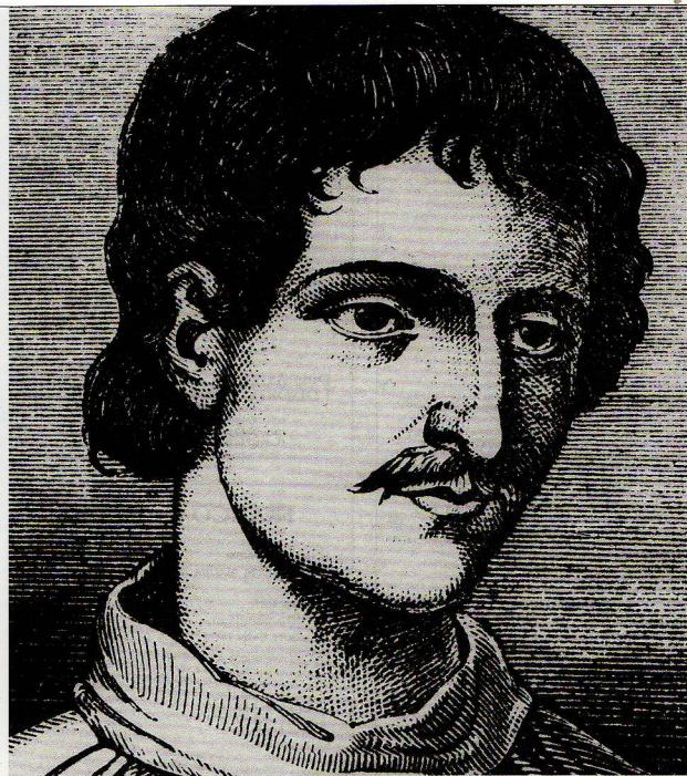
Da sinistra: San Roberto Bellarmino , Bottega ligure, sec. XVII, olio su tela; Bruno Giordano in un'incisione

stenza. Bisogna fare una selezione, avere sempre bene in mente quali sono le cose sulle quali non transigiamo e quelle sulle quali invece si può discutere. Sui capisaldi della mia filosofia potete dire quello che vi pare ma non c'è niente da fare: non posso rinnegare le mie convinzioni, se no sarei niente!