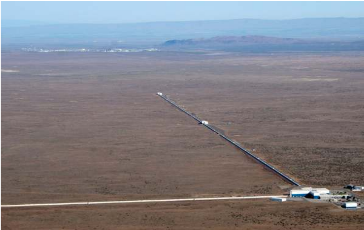
LIGO Hanford Observatory