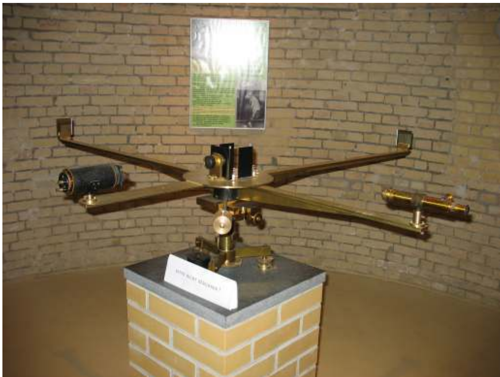
Interfómetro de Michelson

resultado que ambas ondas emplearon igual tiempo, conocido como el experimento de Michelson y Morley, 1887, por lo cual se determinó la constancia universal de la velocidad de la luz en el vacío, adoptado como un principio de la relatividad especial de Einstein, que le mereció el premio Nobel de física en 1907, al físico teórico-experimental, Ph.D, polaco de origen semita, residenciado en los Estados Unidos, Alberto Abraham Michelson, 1852-1931, educado en la Academia Naval de EE.UU y en las universidades de Berlín, Heidelberg, Collège de France y École polytechnique, profesor de física de Case School of Applied Science de Cleveland, 1882-1889, Clark, Worcester, Massachusetts, 1890-1892, Jefe del Departamento de Física de la de Chicago, 1893-1929, además, presidente de la Academia Nacional de Ciencias de Estados Unidos, 1923-1927, y miembro del Observatorio astronómico del Monte Wilson, también, perfeccionó la técnica de la medición de la velocidad de la luz, 1926. El otro autor del famosísimo experimento, fue el químico y físico estadounidense Edward Williams Morley, 1838-1923, profesor de química en el Western Reserve, Hudson, Ohio, 1868, Cleveland Medical College, 1873-1888, y en el Case Western Reserve University, 1869-1906, pero sus contribuciones mayores fueron en la física y la óptica al lado de Michelson, quienes nunca consideraron que con sus hallazgos experimentales refutaban la hipótesis de la existencia del "éter luminífero" [Wikipedia].