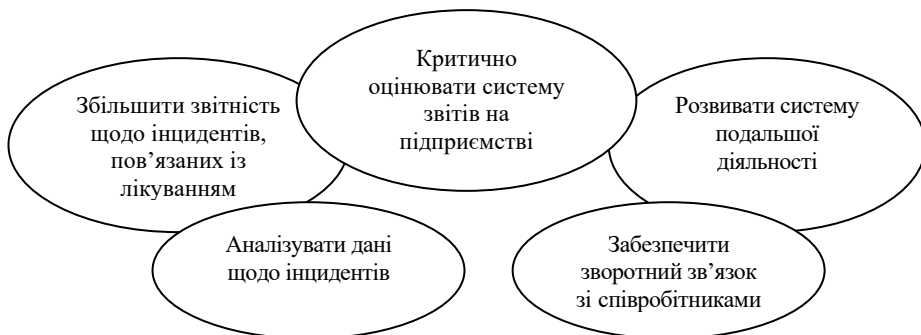
Рис. 3. Формування культури безпеки [17]

Саме тому необхідно створювати культуру безпеки в рамках організаційної культури медичного закладу. Для цього потрібно ужити таких заходів (рис. 3):