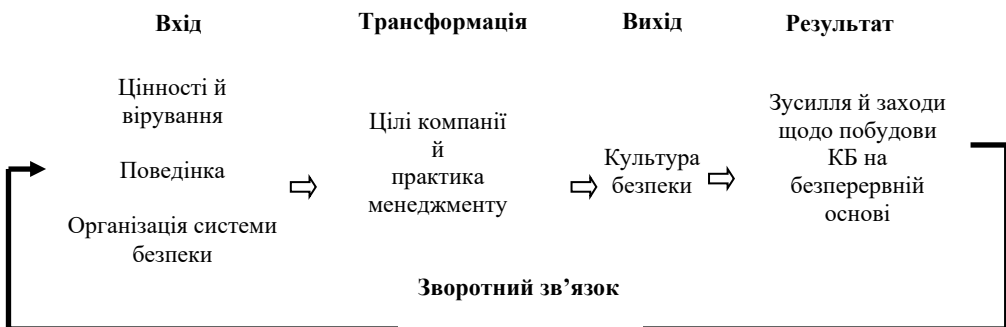
Рис. 2. Бізнес-модель культури безпеки [6, с. 4]

У будь-якій галузі безпеку оцінюють із позиції професіонала та клієнта/споживача. Однак акцент на останнє роблять тільки у сфері послуг, до якої також належить охорона здоров'я. Така ситуація зрозуміла: навіть у країнах із найрозвиненішою медициною лікування не завжди дає очікувані результати. Агентство «Bloomberg» склало рейтинг країн світу за рівнем охорони здоров'я, спираючись на дані Всесвітньої організації охорони здоров'я, Організації Об'єднаних Націй та Всесвітнього банку. Виділимо 10 країн, які мають найкращі системи охорони здоров'я (див. табл. 2).