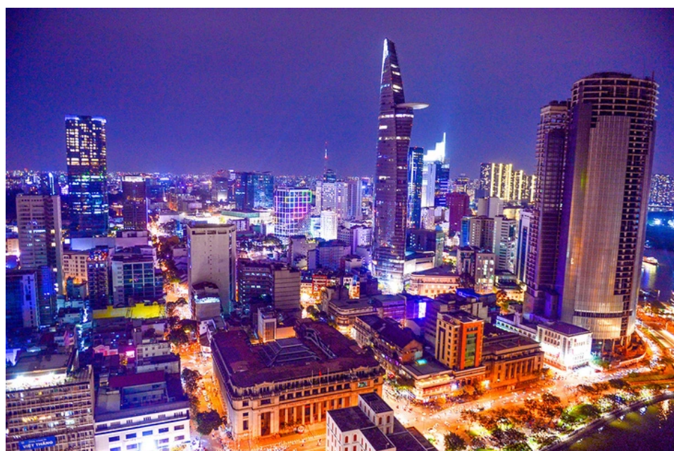
Trung tâm TP.HCM về đêm

TTO - Hôm nay, theo dự kiến, tân Chủ tịch nước và tân Thủ tướng Chính phủ sẽ tuyên thệ nhậm chức. Rất nhiều gửi gắm đã được nêu ra với tân Thủ tướng và bộ máy Chính phủ, đó là phải tạo đột phá đưa đất nước phát triển nhanh hơn nhưng phải bền vững.