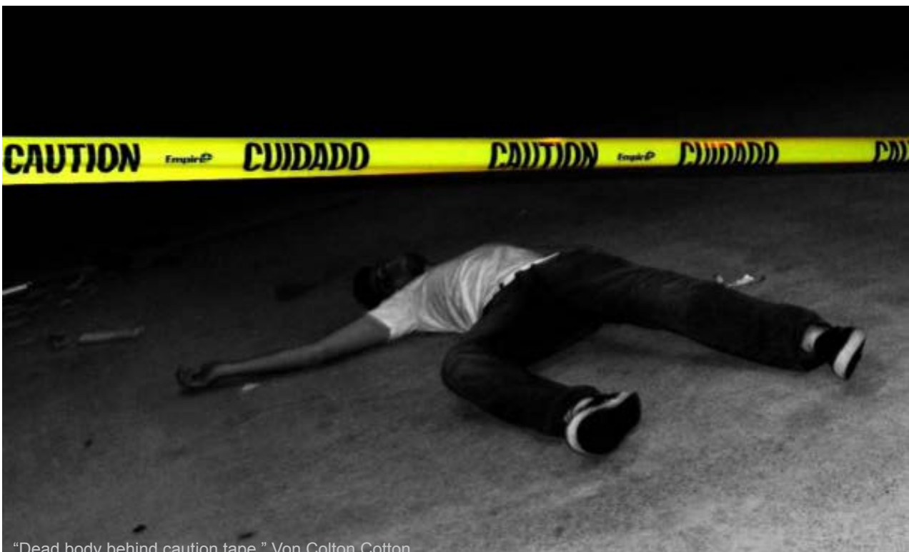
“Dead body behind caution tape.” Von Colton Cotton

Svenja Fasspöhler schrieb zu Arendts Auffassung: „Doch selbst wenn ihre Theorie im Hinblick auf den Nationalsozialismus fragwürdig sein mag, spricht das noch nicht gegen die Theorie als solche. Ja, fast scheint es, als käme das Konzept des banalen Bösen erst heute zu seinem vollen Recht. (...) Eine Gedankenlosigkeit des Konsums, der Produktion und Börsenspekulation, die ökologische Katastrophen, Leid und Armut verursacht, gar Tausende Todesopfer fordert? Für uns ist es nur ein Billigeinkauf, eine Börsenspekulation – anderswo stirbt ein Mensch an Hunger, wird erschlagen in einer einstürzenden Textilfabrik. (...) Wie ist es vor diesem Hintergrund zu verstehen, dass Millionen Menschen jeden Sonntagabend das Böse im Tatort genießen? Hat der Kriminalfilm deshalb heute Konjunktur, weil er uns ein Böses vorführt, das nicht in den Strukturen lauert, sondern ein Gesicht hat – und von dem wir zumindest meinen, uns klar abgrenzen zu können?“ (22)