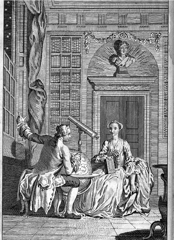
Gentleman and Lady's Philosophy by Wellcome

Ist der Alltag also der Hüter der Perspektive auf den Horizont des „grossen Ganzen“ und