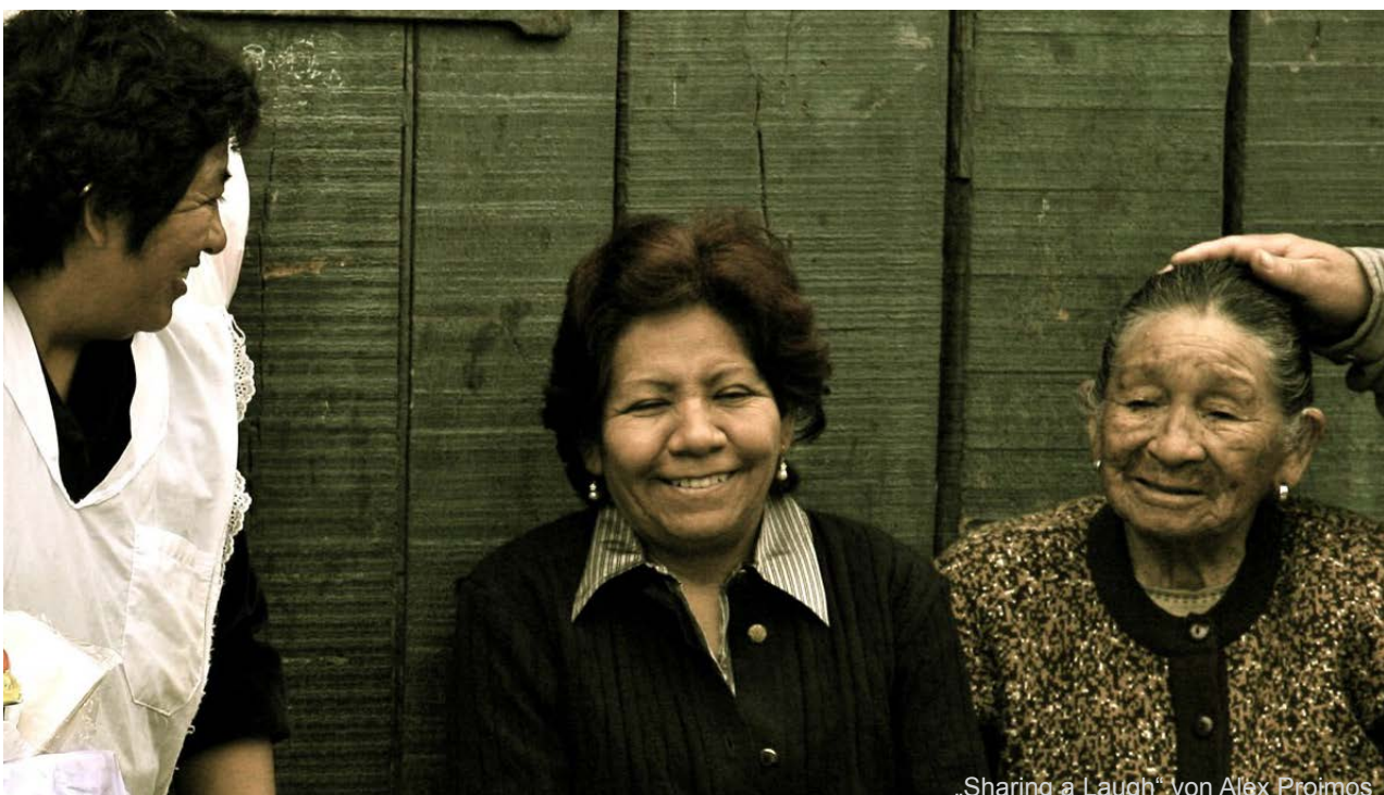
„Sharing a Laugh“ von Alex Proimos

Noch mehr philosophische Beiträge zu den unterschiedlichsten philosophischen Fragen finden Sie ebenfalls auch auf den interaktiven Blogs. Treten Sie direkt in Kontakt mit den Philosophinnen und Philosophen und teilen Sie Ihre Fragen oder Gegenargumente mit auf blogs.philosophie.ch/alltag