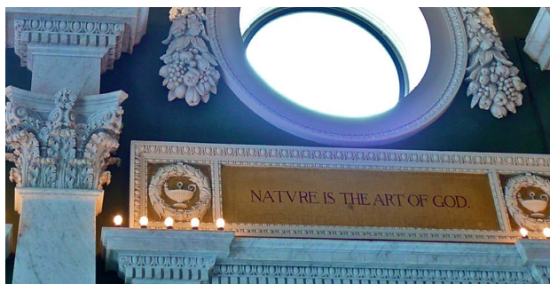
„Nature is the art of God“ von Djembayz

Hoffnung ist schwer zu definieren und nicht einfach zu bewerten. Sie scheint mehr zu sein als eine gewöhnliche, auf ein konkretes Ziel gerichtete Erwartung, weshalb auch die Erfüllung von Hoffnungen so etwas wie einen utopischen Rest übriglässt, d.h. etwas vom Glanz der Vorfreude oder des Ausblicks auf einen fernen Horizont, der beim Näherkommen verschwindet. Hoffnung scheint auf etwas gerichtet zu sein, das sich nie ganz zeigt. Sie ist weniger als Gewissheit und daher meist mit einem Anflug von Zweifel oder Wagnis verbunden. Von den einen wird sie vor allem als Quelle von Illusionen abgewertet, von den anderen wird sie als Tugend gefeiert. Tatsache ist, dass der Alltag ohne Hoffnung „grau“ oder „profan“ wäre.