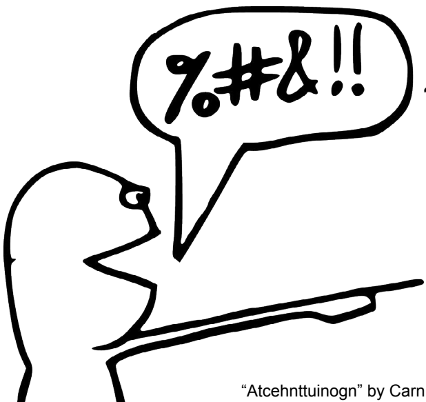
„Atcehnttuinogn“ by Carn

Gemäss Ludwig Wittgenstein kann die Alltagssprache nicht der Gegenstand von Erkenntnis sein, weil sie selbst Bestandteil der zu beschreibenden Phänomene der Welt ist. Zwar lässt sich eine logische Form unseres Denkens über die Welt erkennen, über welche sich jedoch keine sinnvollen sprachlichen Aussagen machen lassen.