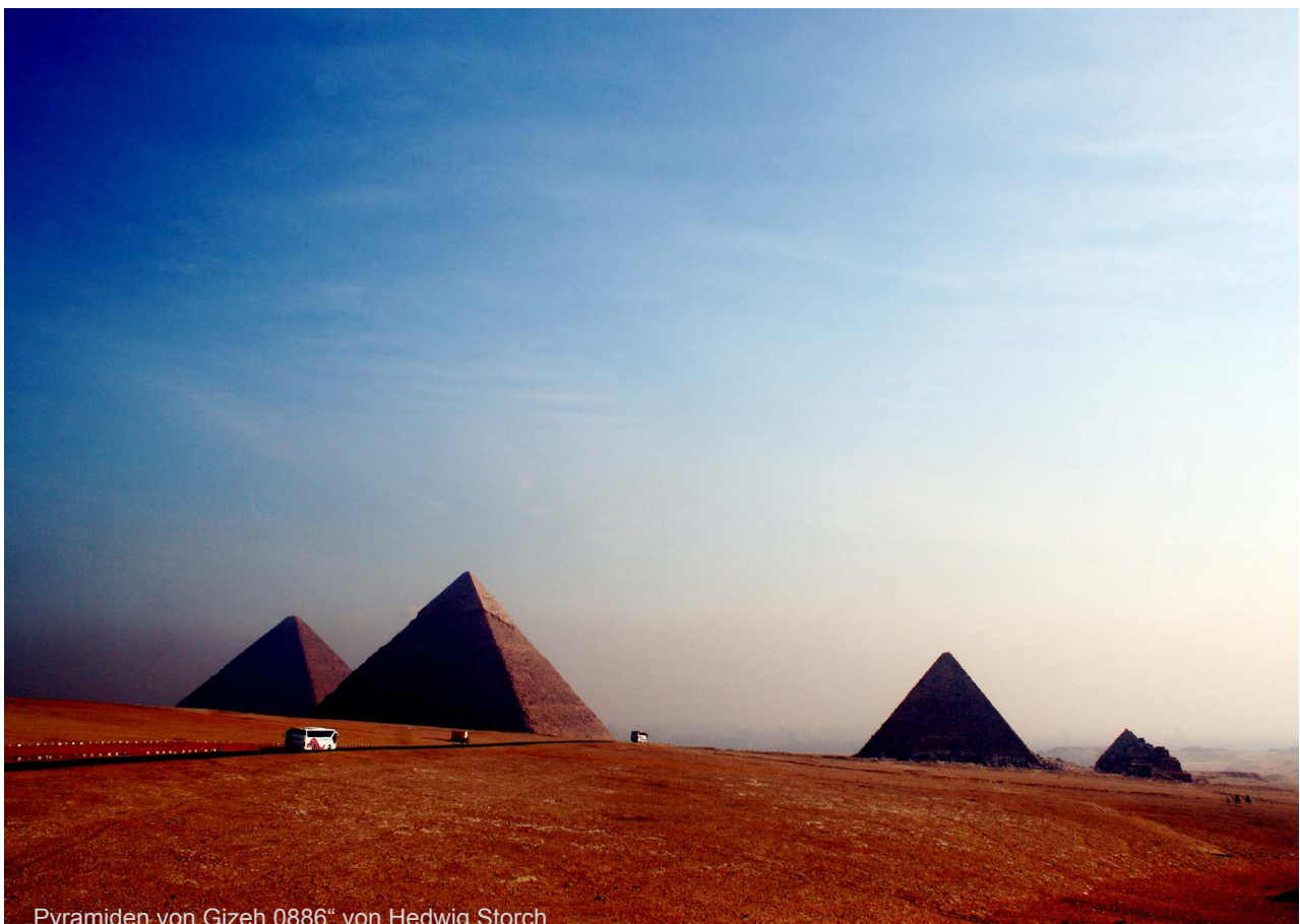
„Pyramiden von Gizeh 0886“ von Hedwig Storch

Auf der anderen Seite, den Naturwissenschaften, verspricht eine so bahnbrechende Entdeckung wie die allgemeine Relativitätstheorie so gut wie keinen Profit. Ferner: Mit den immer besseren Teleskopen der Astronomen kann man zwar der „Natur“ des Universums und mit den immer energiereicheren Beschleunigern, neuerdings mit den Higgs-Teilchen, der „Natur“ der Materie/Energie auf die Spur kommen. Ein wirtschaftlicher Nutzen jedoch liegt, wenn überhaupt, in weiter Ferne. Und im Vergleich mit den Kosten dieser Forschungen erscheinen die der Philosophie gewiß nicht als überhöht. Im Gegenteil: Jeder Finanz-