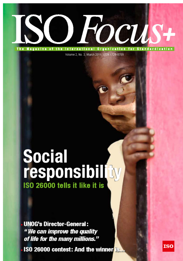
Titelseite von Iso Focus+ (2011), ISSN 1729-8709