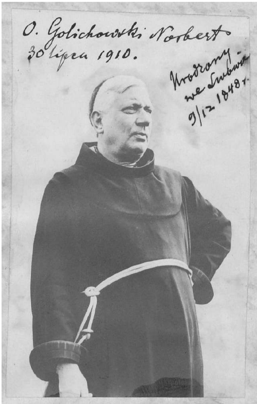
Фото 3: 90487 I