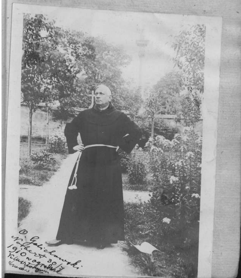
Фото 2: 90483-90484 I