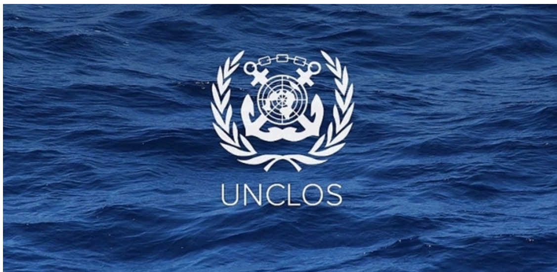
Hầu hết các quốc gia châu Á đều tham gia ký kết Công ước Liên Hiệp Quốc về Luật biển (UNCLOS) 1982

“ Với góc nhìn cụ thể về việc Việt Nam có thể áp dụng Công ước UNCLOS như thế nào, bài nghiên cứu đăng trên Tạp chí Asia Policy cuối tháng 7 khác với một số nghiên cứu trước đó về vai trò của Luật quốc tế trong giải quyết tranh chấp giữa Việt Nam và Trung Quốc. ”