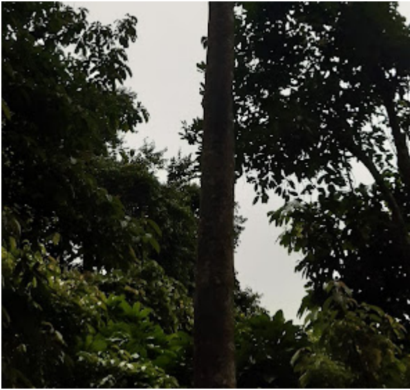
Hình 4: Thỉnh thoảng lắm mới thấy một cây gỗ lớn, trong rừng nhưng lại khá quang đãng, ít vướng các cây bụi hay cây đu bám.

Chỉ vài hình ảnh cũng giúp ta mừng trọng độ hấp dẫn tài nguyên, cũng như mức độ khó khăn của bảo tồn sinh thái rừng, khi mà lợi ích kinh tế gia tăng [1]. Rất may, hiện nay các chính sách bảo vệ rừng nguyên sinh đã được truyền đạt tới từng hộ dân, và sinh kế ở vùng đất rừng dưới thấp hơn cũng đã cải thiện và đa dạng. Đây là điều kiện tiên quyết để cách chính sách phát triển bền vững, không hy sinh rừng và tài nguyên sinh thái để đổi lấy lợi ích kinh tế trước mắt [2] có thể được thực thi hiệu quả.