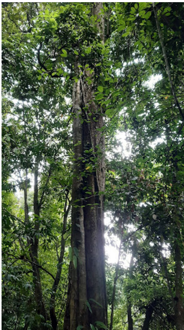
Hình 3: Cây thân gỗ lớn cao vút, quanh đó bám một cây khả năng cây đa.

Cây bám nhờ thân gỗ trong H3 cũng nhờ thế mà vươn cao vút lên, kích thước cũng khủng khiếp. Cả đôi này đều đón được nắng trên cao giữa núi rừng.