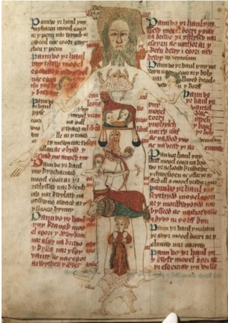
(Omul Zodiac, o diagramă a unui corp uman și simboluri astrologice cu instrucțiuni care explică importanța astrologiei dintr-o perspectivă medicală. Dintr-un manuscris din Țara Galilor din secolul 15)

Astrologia este formată dintr-un conglomerat de sisteme, tradiții și credințe conform cărora mișcarea și pozițiile corpurilor cerești pot oferi informații despre personalitatea oamenilor și viitorul acestora, având capacitatea de a prevesti toate fenomenele și evoluțiile viitoare care influențează omenirea în ansamblul ei și oamenii ca indivizi. Multe culturi au identificat cerul și Cosmosul cu spațiul rezervat zeităților.