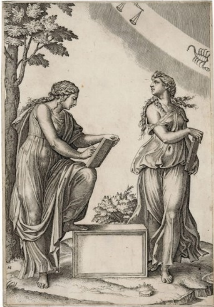
(Gravură de Marcantonio Raimondi, secolul al 15-lea)

de unde s-a răspândit în Grecia antică, Roma, lumea arabă și Europa de Vest și în cele din urmă în Europa Centrală. Astrologia occidentală contemporană este adesea asociată cu sisteme de horoscoape, care pretind a explica aspecte ale personalității unei persoane și prezice evenimente semnificative în viața lor, bazate pe pozițiile de obiecte cerești; majoritatea astrologilor profesionale se bazează pe astfel de sisteme.