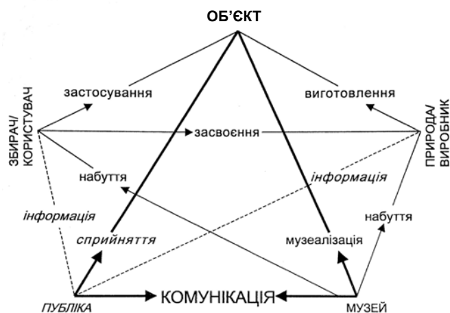
Рис. 4. Пентаграма зв'язків об'єкта (за Ф. Вайдахером)

На нашу думку, місце музеології (музеєзнавства) в системі наук є дискусійною проблемою. Зокрема, Р. В. Маньковська, аналізуючи це питання, зазначає, що у Загребі (Хорватія) музеологію відносять до інформаційних наук, в Чехії – до історичних, в Росії – спочатку до історичних, потім культурологічних (як і в Україні), а сама дослідниця вважає, що музеологія формується на стику соціального і гуманітарного пізнання [5, с. 137–138]. Цієї точки зору дотримуються й деякі інші науковці [напр.: 3, с. 67]. Ф. Вайдахер же наголошує, що за своїм підходом до оцінки