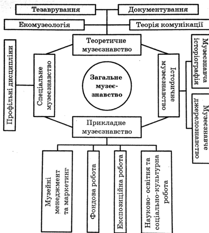
Рис. 3. Структура музеєзнавства (за М. Й. Рутинським та О. В. Стецюк)

та суспільством і його окремими інституціями [10, с. 152].