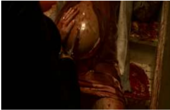
Imagem 19 - O parto no horror