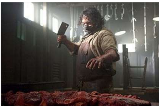
Imagem 15 - O abate e açougueiro no horror

Fonte: Filme O massacre da serra elétrica (1974).