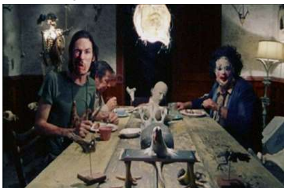
Imagem 13 - A mesa do horror