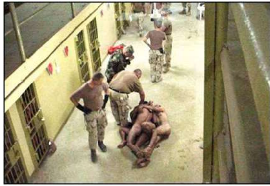
Imagem 2 - Horror e poder (Abou Ghraib)