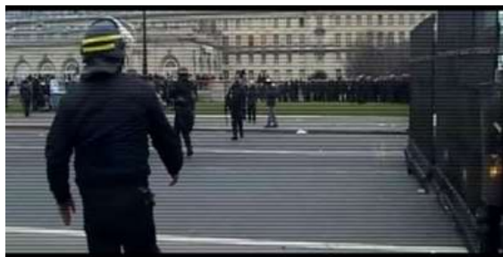
Imagem 7 - A repressão e o horror