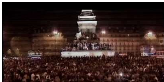
Imagem 8 - Em defesa do corpo social