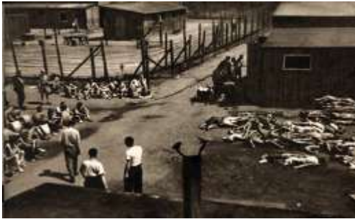
Imagem 5 - Campo de contração nazista, 1945