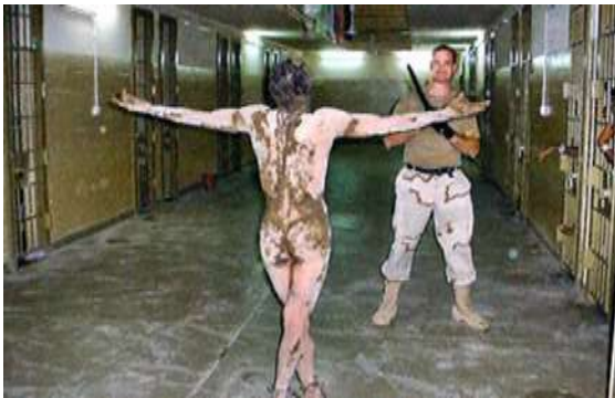
Imagem 3 - Horror e biopoder (Abou Ghraib)