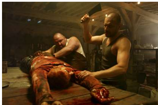
Imagem 16 - O corpo em abate