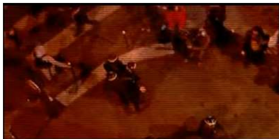
Imagem 9 - Vigilância dos corpos