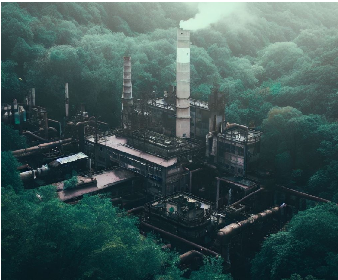
Nhà máy xả thải ra môi trường

Thị trường carbon toàn cầu đã trở thành một yếu tố quan trọng trong cuộc chiến chống biến đổi khí hậu, cung cấp cơ hội cho các chính phủ, doanh nghiệp và tổ chức giảm lượng khí thải khí nhà kính. Tuy nhiên, với sự gia tăng về tầm quan trọng của thị trường carbon, sự phức tạp trong quản lý nó cũng tăng lên. Một trong những thách thức lớn, mà thị trường carbon phải đối mặt là sự tồn tại của nhiều tiêu chuẩn và đôi khi xung đột với nhau. Mặc dù các tiêu chuẩn này được phát triển để phục vụ các bên liên quan cho mục tiêu khác nhau, nhưng chúng cũng tạo ra sự hỗn loạn, làm giảm hiệu suất và gây ra các vấn đề tiềm ẩn. Bài viết này sẽ xem xét các vấn đề xung quanh sự tồn tại quá nhiều tiêu chuẩn trên thị trường carbon và thảo luận về sự cần thiết của việc hài hòa hóa chúng một cách hợp lý hơn.