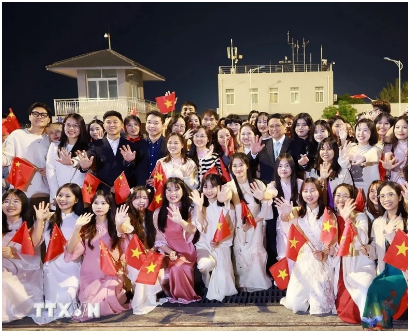
Lưu học sinh, sinh viên tiễn Thủ tướng Phạm Minh Chính kết thúc chuyến thăm và làm việc tại Trung Quốc.