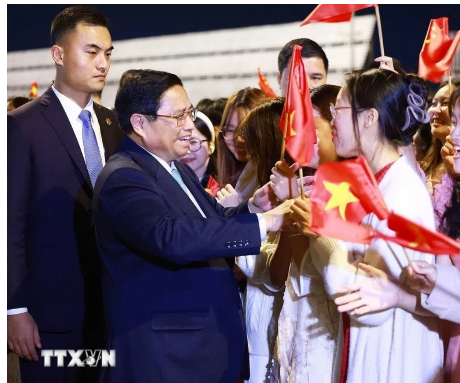
Lễ tiễn Thủ tướng Phạm Minh Chính kết thúc chuyến thăm và làm việc tại Trung Quốc.

Chiều tối 8/11, Thủ tướng Phạm Minh Chính rời thành phố Trùng Khánh về nước, kết thúc chuyến tham dự các Hội nghị GMS 8, ACMECS 10, CLMV 11 và làm việc tại Trung Quốc.