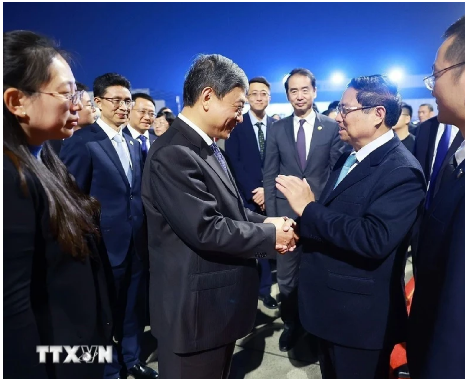
Lễ tiễn Thủ tướng Phạm Minh Chính kết thúc chuyến thăm và làm việc tại Trung Quốc.