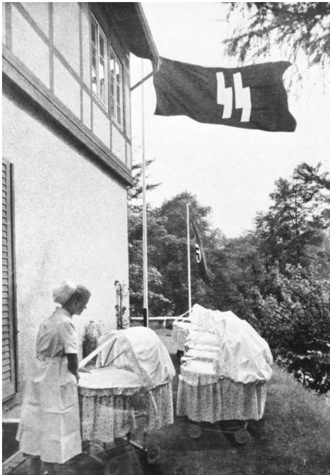
(O casă de naștere din Lebensborn în Germania nazistă, creată cu intenția de a crește rata natalitatea