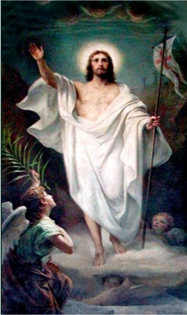
(Victorie asupra mormântului, de Bernard Plockhorst)

Noul Testament leagă Cina cea de taină și crucificarea lui Iisus de Paștele evreiesc și exodul din Egipt. Iisus s-a pregătit pe el însuși și pe discipolii săi pentru moartea sa în timpul Cinei, dând mesei de Paștele evreiesc un nou înțeles. El a identificat pâinea și cupa de vin ca simbolizând corpul său care va fi sacrificat curând și sângele său care urma să fie vărsat. În Prima Epistolă către Corinteni a Sfântului Apostol Pavel, Capitolul 5, el spune: “Curățiți aluatul cel vechi, ca să fiți frământătură nouă, precum și sunteți fără aluat; căci Paștile nostru Hristos S-a jertfit pentru noi.” , făcând referire la tradițiile Paștelui evreiesc și identificându-se cu mielul Pascal.