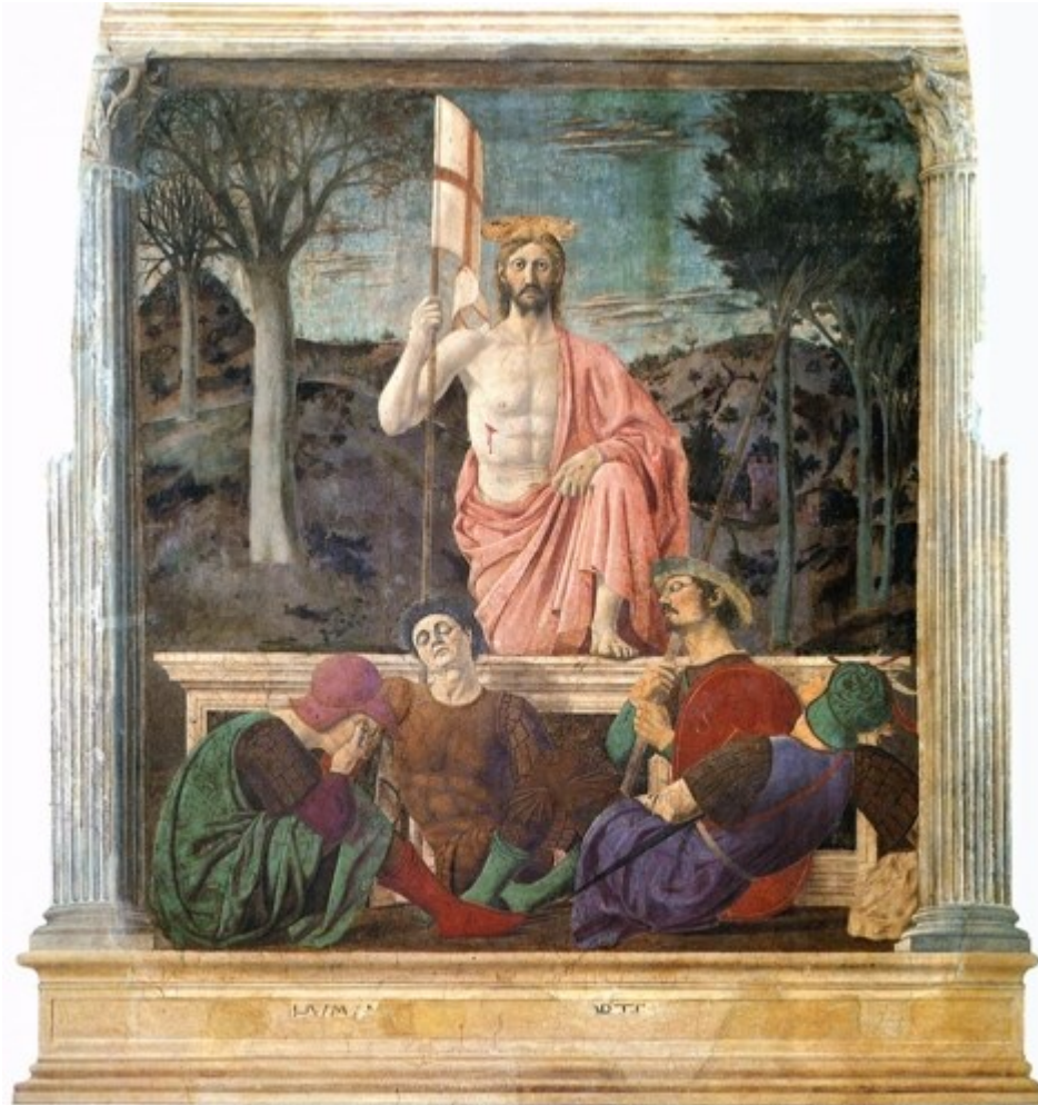
(Piero della Francesca - Învierea)

Paștele este o sărbătoare religioasă cu dată schimbătoare, atât în calendarul iulian cât și în cel gregorian. În fapt, data în care se celebrează Paștele se determină pe baza unui calendar lunisolar similar cu calendarul ebraic. Primul Consiliu de la Niceea (325) a stabilit ca dată a Paștelui prima duminică după luna plină (Luna plină pascală) de după echinocțiul de primăvară din emisfera nordică. Din punct de vedere ecleziastic, echinocțiul este considerat a fi la data de 21 martie (chiar dacă din punct de vedere astronomic cele mai multe echinocții sunt pe 20 martie), iar “Luna plină” nu este neapărat o dată corectă din punct de vedere astronomic.