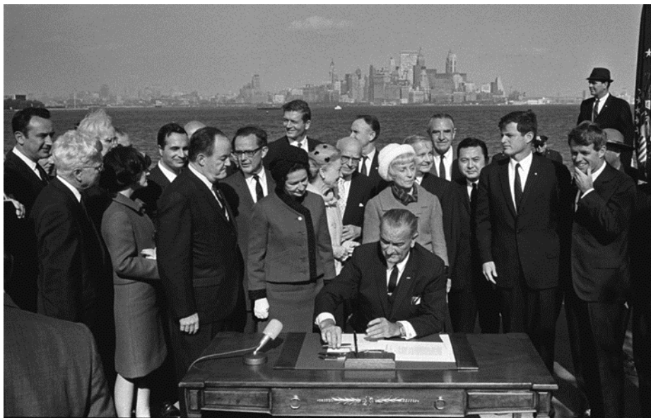
Η πιο θλιβερή μέρα στην ιστορία των ΗΠΑ. Πρόεδρος Johnson, με 2 Κένεντι και πρώην Πρόεδρος Χούβερ, δίνει Αμερική στο Μεξικό - 3 Οκτωβρίου 1965

ποσοστό των φτωχών από τη φτώχεια και να τους κρατήσει εκεί. Η προσπάθεια να γίνει αυτό χρεοκόπησε την Αμερική και καταστρέφει τον κόσμο. Η ικανότητα της γης να παράγει τρόφιμα μειώνεται καθημερινά, όπως και η γενετική μας ποιότητα. Και τώρα, όπως πάντα, μακράν ο μεγαλύτερος εχθρός των φτωχών είναι άλλοι φτωχοί και όχι οι πλούσιοι. Χωρίς δραματικές και άμεσες αλλαγές, δεν υπάρχει καμία ελπίδα για την πρόληψη της κατάρρευσης της Αμερικής, ή οποιασδήποτε χώρας που ακολουθεί ένα δημοκρατικό σύστημα.