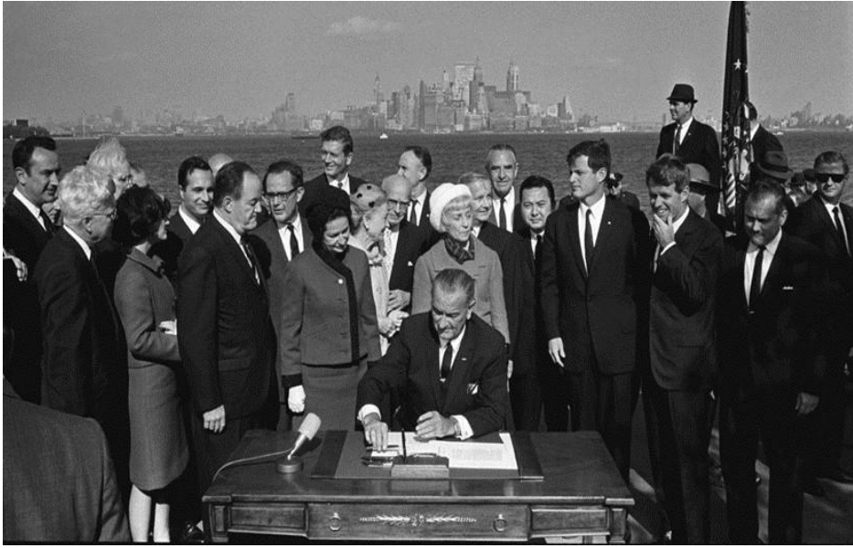
Самый печальный день в истории США. Президент Джонсон, с двумя Кеннеди и экс-президент Гувер, дает Америке В Мексику - 3 октября 1965