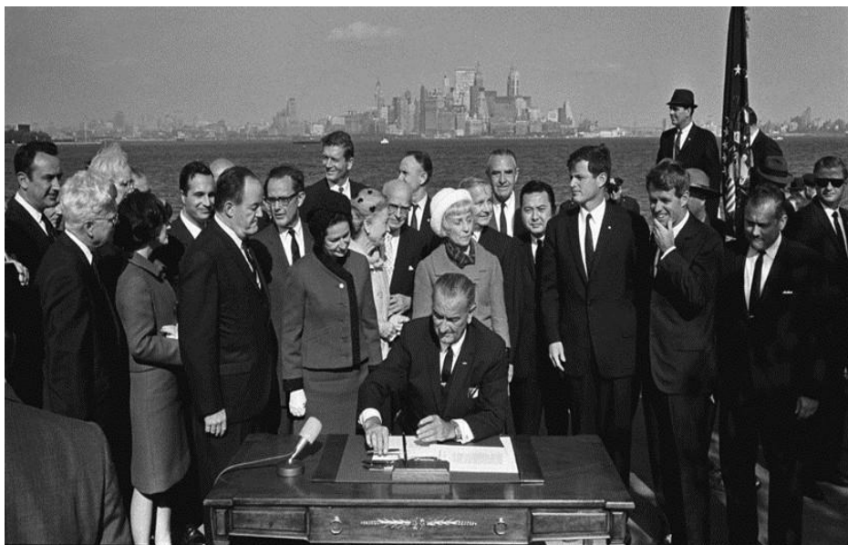
El día más triste de la historia de Estados Unidos. El presidente Johnson, con dos Kennedys y el ex-presidente Hoover, da a Estados Unidos a México - 3 de Octubre de 1965