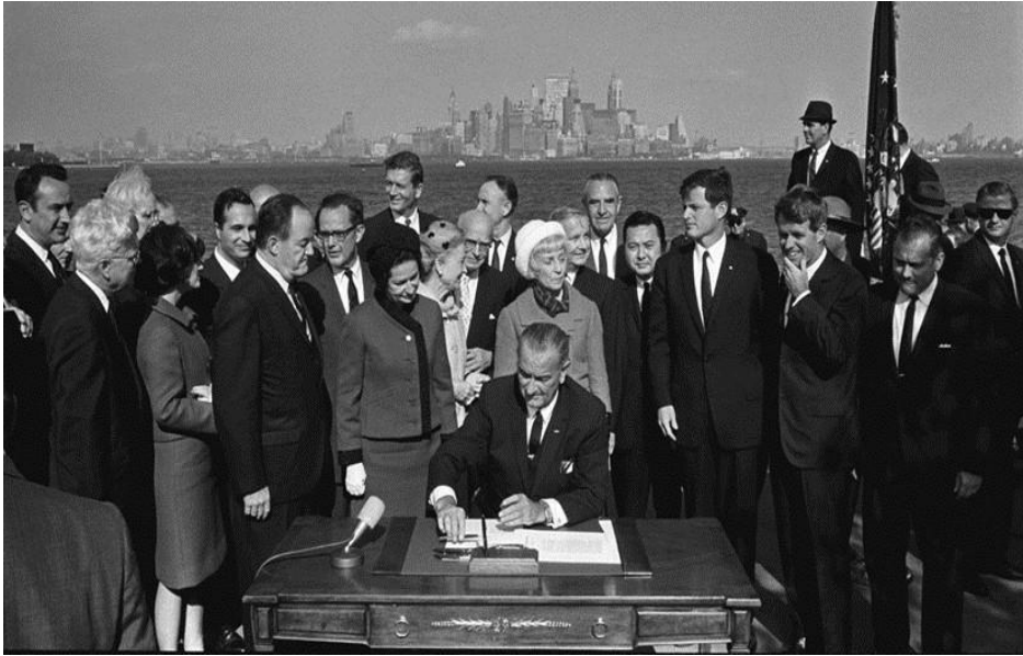
Hari yang paling menyedihkan dalam sejarah AS. Presiden Johnson, dengan dua Kennedys dan mantan Presiden Hoover, memberikan Amerika untuk Meksiko-Oct 3rd 1965