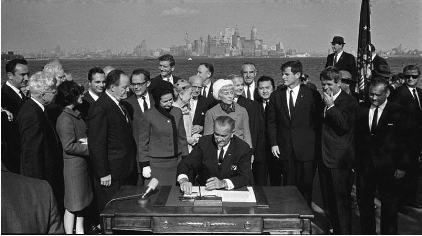
Hari yang paling menyedihkan dalam sejarah AS. Presiden Johnson, dengan 2 Kennedy dan mantan Presiden Hoover, memberikan Amerika untuk Meksiko-3 Oktober 1965