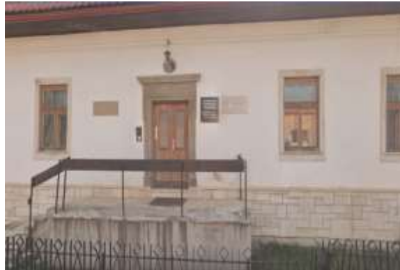
Obr. 1 fara Batizovce