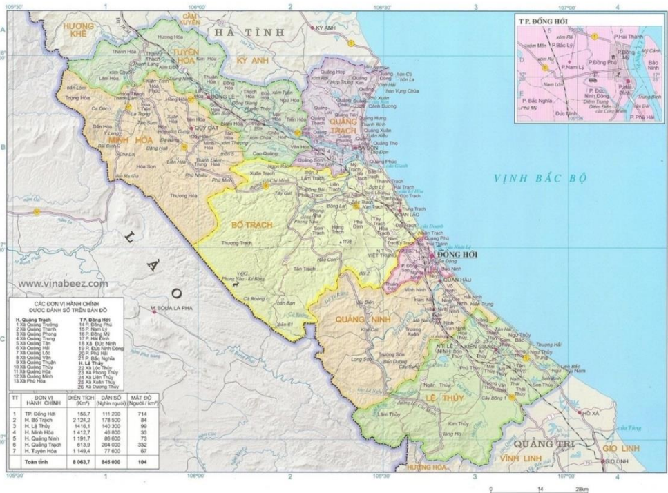
Hình 1. Bản đồ khu vực nghiên cứu

Đầu tư phát triển cơ sở hạ tầng chưa đáp ứng được yêu cầu chuyển đổi cơ cấu sản xuất nông, lâm, thủy sản, nhất là vùng miền núi (đặc biệt là giao thông, thủy lợi, thông tin liên lạc).