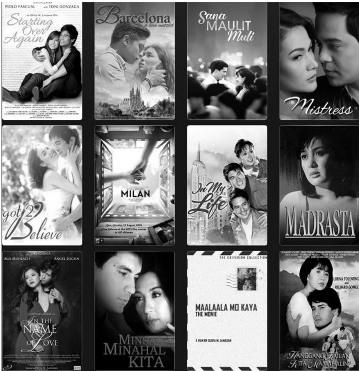
Larawan 1. Mga pelikula ni Olivia Lamasan (Letterboxd, w.tn.)

Malaki ang naging impluwensiya ng ina ni Lamasan sa kaniyang maagang pagkahumaling sa pelikula. Masugid na tagahanga ni Nora Aunor ang kaniyang ina. Lagi niyang dinadala ang batang si Lamasan sa tuwing ipinapalabas ang mga pelikula ni Nora (Tariman, 2014). Mula taong 1994 hanggang sa kasalukuyan, may labindalawang pelikula (larawan 1) nang idinirihe si Lamasan (LB, w.tn.; Cagape, 2018). Sa pangkabuoan, ito ay tumuon sa kuwentong pag-ibig na tipolohikal na nahahati batay sa tema– (1) pampamilyang pag-ibig ; (2) bawal na pag-ibig ; at (3) romantikong pag-ibig (diagram 2). Kalimitan din itong ipinaghuhugpong ni Lamasan sa kuwento ng paghahanapbuhay.