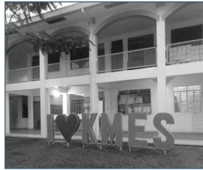
Larawan 14. Kapitan Moy Elementary School. Kuhang larawan ng may-akda noong Oktubre 13, 2020.

noon ang mismong tahanan ni Kapitan Moy pagkatapos itong idoneyt ng angkan sa pamahalaan noong Marso 11, 1912 (KMES, w.tn). Naging ganap na paaralang elementarya ang Kapitan Moy noong Hunyo 4, 1976 (KMES, w.tn). Sa pagdaan ng panahon, inilipat ang Paaralang Kapitan Moy sa pinaghahatiang espasyo nito sa Marikina Elementary School bago ang taóng 2000 (Basijan, 2020). Kinalauna’y inilipat muli ang Paaralang Kapitan Moy malapit sa/mismo sa Marikina Heights High School (na itinayo naman noong Mayo 30, 2000 at naging hiwalay na paaralan noong Marso 2, 2004) (MHHS, 2004). Sa ngayon, isa nang hiwalay na paaralan ang Kapitan Moy Elementary School [cf. Larawan 14]. Patunay ang paaralang ito sa naging kontribusyon at pagkilala kay Kapitan Moy ng mga Mariqueño.