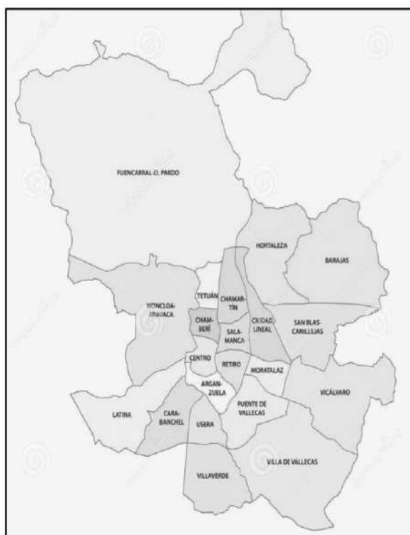
Pig 4. Lugar ng Chamberi sa Madrid, Spain (DT w.tn)

asawa ko dahil sa finacial . Maraming adjustment sa aking buhay nang ako'y nasa España na, isa na roon yung homesick sa pamilya mo na nasa Pilipinas, klima, surroundings , mga pagkain, at pakikitungo sa ibang lahi (Martinez 2018).