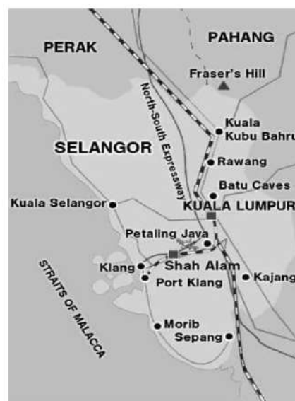
Fig. 1. Mapa ng Selangor (JM 2018)

Nasa Malaysia na ako noong 1997 pero nagsimula akong maging OFW noong 1982. Single Mom kasi ako kaya kailangan kong kumayod. Naging dahilan din ng aking pangigingbang bansa ang pagsasara ng pabrika ng mga garments noong 1982. Domestic Helper ako ngayon dito sa Selangor. Kahit sa tagal ko na rito, buhay pa rin sa utak ko ang pusong Pilipino. Alam ko na isa pa rin akong Pilipino. Pinoy pa rin ako kahit matagal na ako rito at never ever think na tumira rito for life. I love my own country siyempre. In other ways din, mas okay dito kasi may work and I can earn despite of my age. Diyan kasi sa Pilipinas ay may age limit (Tapales 2014).