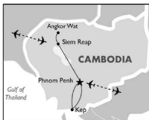
Pig 3. Mapa ng Kep, Cambodia (GW w.tn)

Walang direktang diskriminasyon o marhinalisasyong nararanasan ang ilang mga Pilipinong manggagawa sa mga Cambodian. Bukod sa kakaunti sila sa bansang ito, mataas din ang tingin ng mga Cambodian sa mga Pilipinong manggagawa. Tinutulungan ng mga Pilipino ang mga Cambodian upang makabangon sa labis na kahirapan dulot ng mga nagdaang sigalot (Avenidaño 2012). 10 Tinitingala nila ang mga Pilipinong manggagawa lalo na ang mga doktor. Kulang sa mga doktor ang Cambodia. Sa limang libong pasyente, isang doktor lamang ang gumagamot o nakalaan para rito (Avenidaño 2012). Dahil nga sa walang diskriminasyon at instrumentong magdudulot para rito, kung kaya't iba ang naging paraan ng mga Pilipino roon upang ipakilala ang identidad ng mga Pilipino. Ipinakilala nila ito sa pamamagitan ng pagsasagawa at pagsasabuhay ng kaugaliang Pilipino.