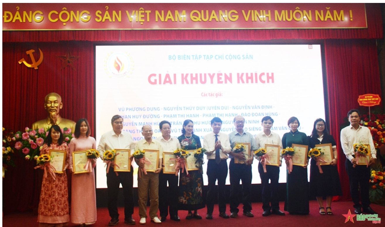
Lãnh đạo Tạp chí Công sản trao giải cho các tác giả đoạt giải.

Đây là năm thứ bảy Giải “Ngon lửa” được tổ chức. Các tác phẩm dự thi tham dự lần này là những bài viết được đăng trên các ấn phẩm của Tạp chí Công sản từ ngày 1-1-2023 đến 30-6-2024, bao gồm các ấn phẩm: Tạp chí Công sản số in, Tạp chí Công sản Chuyên đề, Tạp chí Công sản Điện tử và Chuyên san Hồ sơ sự kiện.