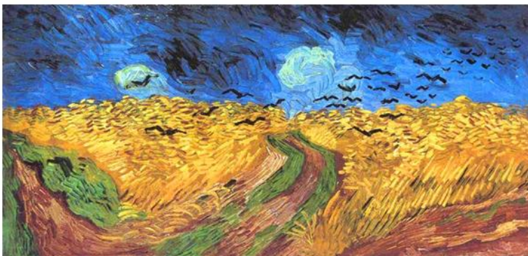
Campo di grano con volo di corvi

C'è un passaggio di una lettera a Theo che fa cogliere ancora di più quell'intenso fluido che ci consente di condurre Van Gogh nei pressi di Leopardi: