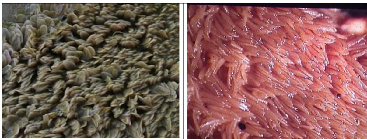
Figura 5 e 6: Desenvolvimento das papilas ruminais. Observe como uma dieta que gera baixa produção de AGV causa um baixo desenvolvimento papilar (esquerda), enquanto uma dieta energética estimula seu crescimento (direita).

A capacidade do rúmen e a ingestão de alimentos sólidos estão intimamente relacionadas. O desenvolvimento do rúmen é muito lento em bezerros alimentados com grandes quantidades de leite. O leite satisfaz seus apetites para que eles não tenham fome suficiente para comer qualquer alimento sólido. Logo, é necessário diminuir paulatinamente o fornecedor do leite para esses animais, favorecendo a ingestão de alimentos sólidos e desenvolvendo o rúmen, estômago que digere as fibras das forragens e que os tona animais peculiares.