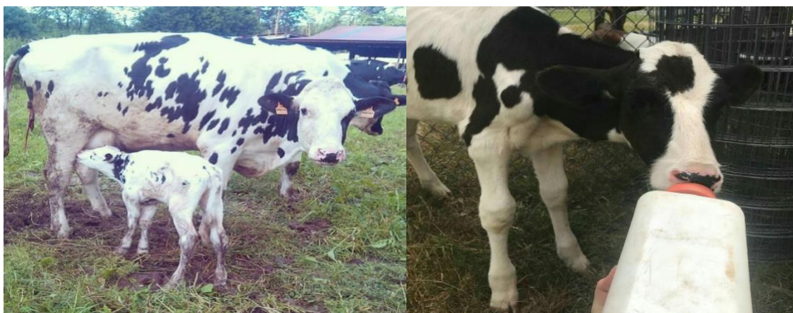
Figura 3 e 4: Os bezerros necessitam do leite como fonte primária de alimentação até às seis semanas de vida.

bezerros amamentam-se através das tetas das mães, mas às vezes não funciona quando bebem de um balde. Essa parece ser uma condição psicológica em resposta aos bezerros separados de suas mães. A maioria dos bezerros podem ser treinados pelo tratador para beber o leite do balde rapidamente e bem, a metodologia empregada é a da persuasão do animal, ao qual o mesmo possa responder positivamente à nova rotina diária e à mãe substituta na forma do criador do bezerro. Quando o leite ou o substituto do leite entra no abomaso, forma um coágulo firme dentro de alguns minutos sob a influência das enzimas renina e pepsina. Este é o mesmo processo envolvido na fabricação de queijo ou junket, usando renina para coagular a proteína do leite. A coagulação do leite retarda a taxa em que flui para fora do abomaso, permitindo assim uma liberação constante de nutrientes alimentares em todo o intestino e, eventualmente, para a corrente sanguínea. Pode levar de 12 a 18 horas para que a coalhada de leite seja totalmente digerida.