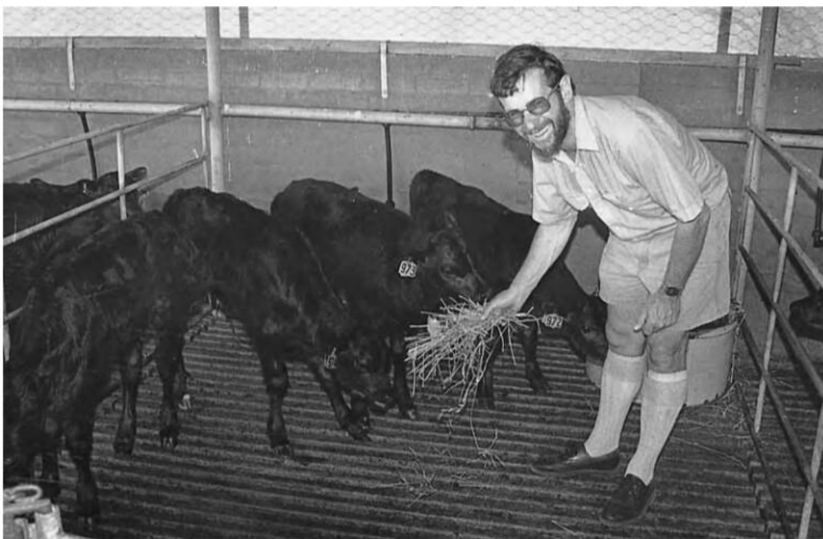
Figura 7: A alimentação volumosa de bezerros alimentados com leite é uma questão controversa.

Os sistemas de criação de bezerros australianos frequentemente diferem dos demais, especialmente em áreas de parto sazonais. Um número excessivo elevado de bezerros precisam ser criados de uma só vez para lhes fornecer, a todos, currais individuais durante todo o seu período de amamentação. Conseqüentemente, os bezerros são criados em grupos. Além disso, os ingredientes da maioria dos concentrados para esses animais são finamente moídos. Nessas situações, descobriu-se que a palha limpa é um alimento útil e que deve ser incluso no período pré-desmame. Alguns agricultores preferem feno de boa qualidade, porém estes agricultores geralmente têm bezerros em grupos muito pequenos, muitas vezes um ou dois, por isso possuem maior controle sobre a ingestão de forragem.