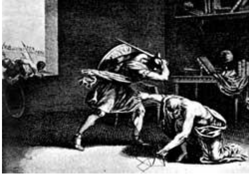
Soldado romano matando Arquimedes (cerca de 290/280 a 212/211 a.C.)

O nascimento do infinitésimo como uma solução aos problemas criados pela incomensurabilidade não foi aceito tranquilamente pela geometria grega. Fora do rigor geométrico matemático, uma nova escola filosófica surgiu em Elea, na Magna Grécia. Esta escola foi altamente crítica da escola de Abdera. Ao contrário de proclamar que os objetos eram constituídos como agregados de unidades, os eleatas apontavam contra a visão atomista a essência única do mundo e a aparente falta de mudança. Esta visão era sustentada por Parmênides, com um toque cético do aclamado filósofo-poeta Xenofonte.