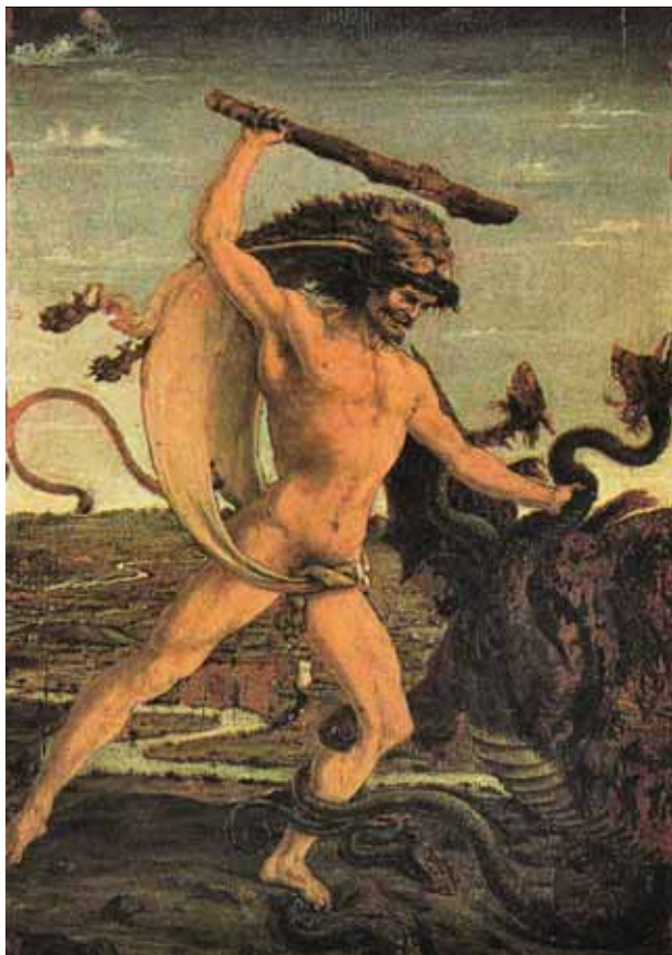
Antonio del Pollaiuolo (1431-1498), Ercole e l'Idra (1475 ca.), Firenze, Galleria degli Uffizi

quei soli non è vista, li quali non veggono nulla. [...] questi soli son meritevoli d'esser perseguitati dal cielo e da la terra, ed esterminati come peste del mondo, e non son più degni di misericordia che gli lupi, orsi e serpenti, nel spenger de quali consiste opra meritoria e degna.