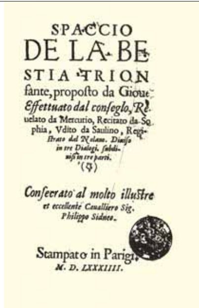
Frontespizio della prima edizione dello Spaccio de la bestia trionfante di Giordano Bruno (Londra, 1584)

Animo sinceramente religioso fino al fanatismo, abbraccia la dottrina luterana con una tale partecipazione spirituale, da affrontare la morte, senza