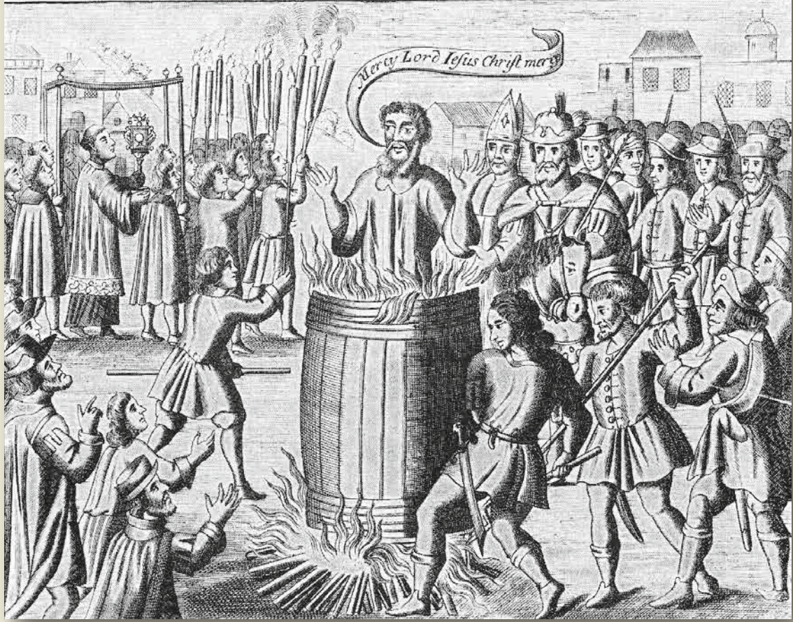
The description of the horrible Burning of Iohn Badby, and how he was used at his death