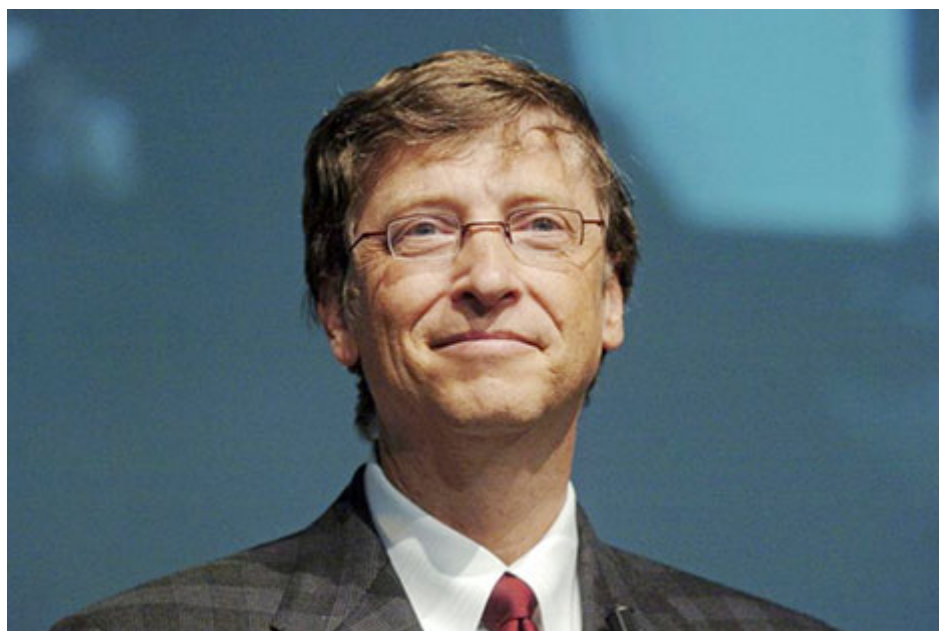
Bill Gates là một trong những nhà thông thái đa năng của kỷ nguyên hiện tại.

Một nhận xét mà chúng ta thường nghe mỗi khi đi họp lớp kèm với sự thắc mắc: “Thằng A này ngày xưa học không giỏi, nhưng giờ lại thành công. Còn thằng B ngày xưa giỏi nhất lớp, giờ lại bình thường”. Khái niệm “nhà thông thái đa năng” sẽ giúp chúng ta kiến giải hiện tượng này.