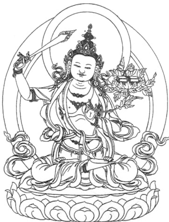
Рис. 1. Манджушрі