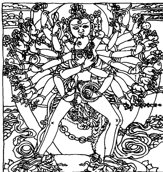
Рис. 3. Йідам Калачакри

Висновки. Для схематичного позначення перспективи дослідження взаємин трьох часових вимірів простору, які пропонує КЧ, та як певний проміжний висновок доречно знову послатися на слова Дж. Андресен, якими вона у своєму вступі до когнітивних студій (у співавторстві з Р. Форманом) коментує буддійське визначення свідомості , де, вочевидь, дається взнаки її ґрунтовне дослідження Калачакри: