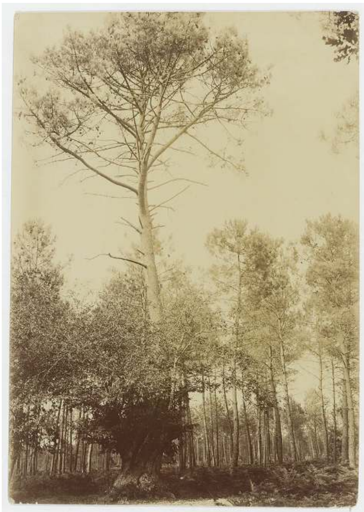
Vieux pin sur un châtaignier à Ygos (Landes). Cliché de Félix Arnaudin, fin XIX e . Collection musée d'Aquitaine

Relisons Pierre de Ronsard, qui écrivait en 1565 :