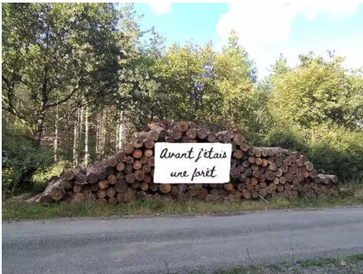
Tas de bois « revendicatif » à Saint-Augustin-des-Bois (Maine-et-Loire).