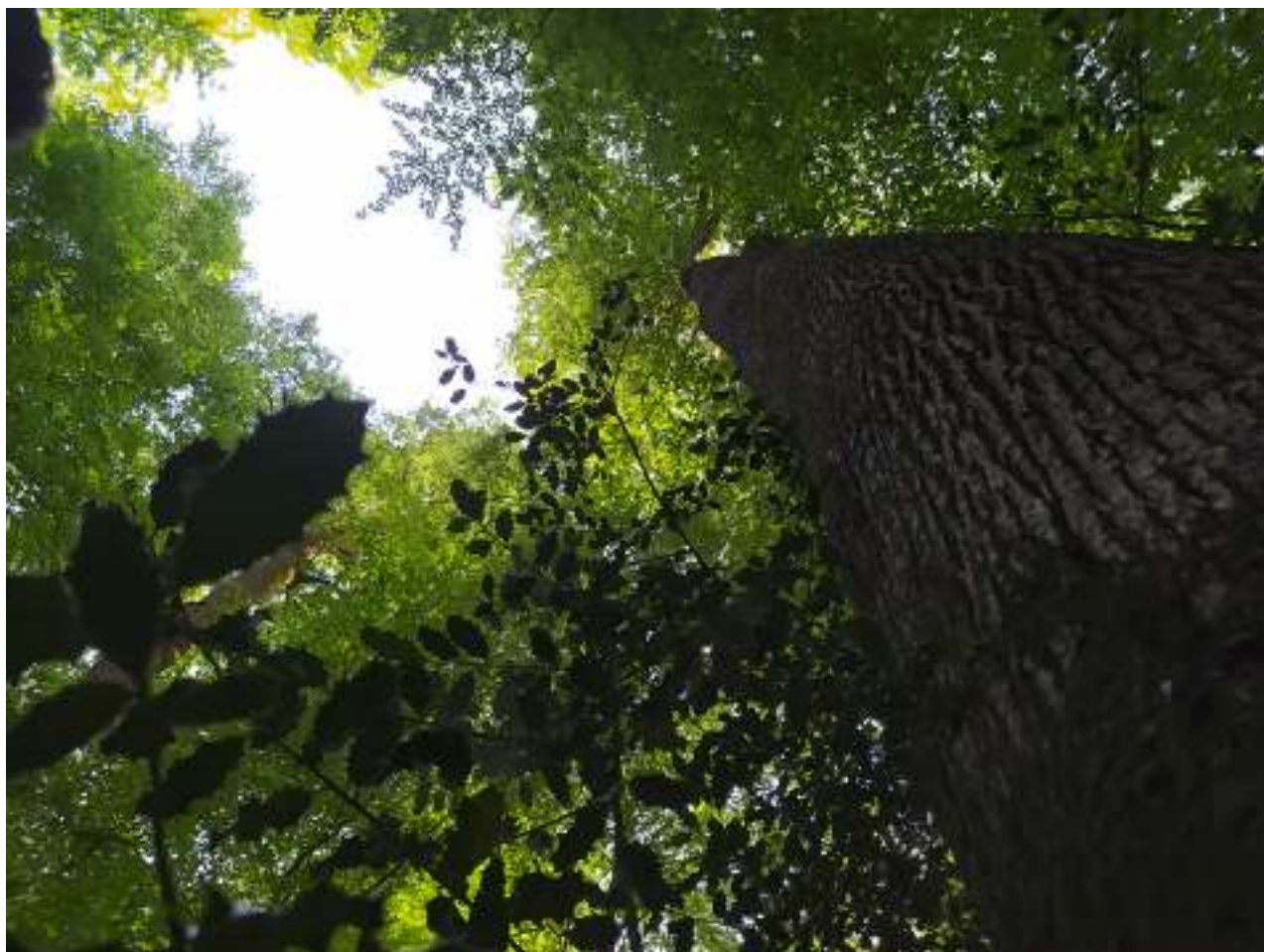
Sous-bois de la futaie des Clos, site emblématique de la forêt domaniale de Bercé (Sarthe).