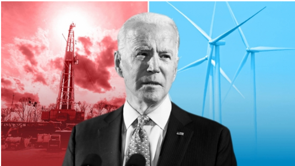
Ông Joe Biden chủ trương đẩy mạnh khai thác năng lượng sạch với lời hứa tạo khoảng 10 triệu việc làm cho người Mỹ

Tuy nhiên, những chính sách này đã tạo nên nhiều tranh cãi. Trong bài viết này, chúng tôi đi sâu vào sự phức tạp trong các chính sách môi trường của Tổng thống Biden, đặc biệt tập trung vào lệnh cấm cấp phép khai thác dầu khí mới trên các vùng đất và vùng biển công cộng.