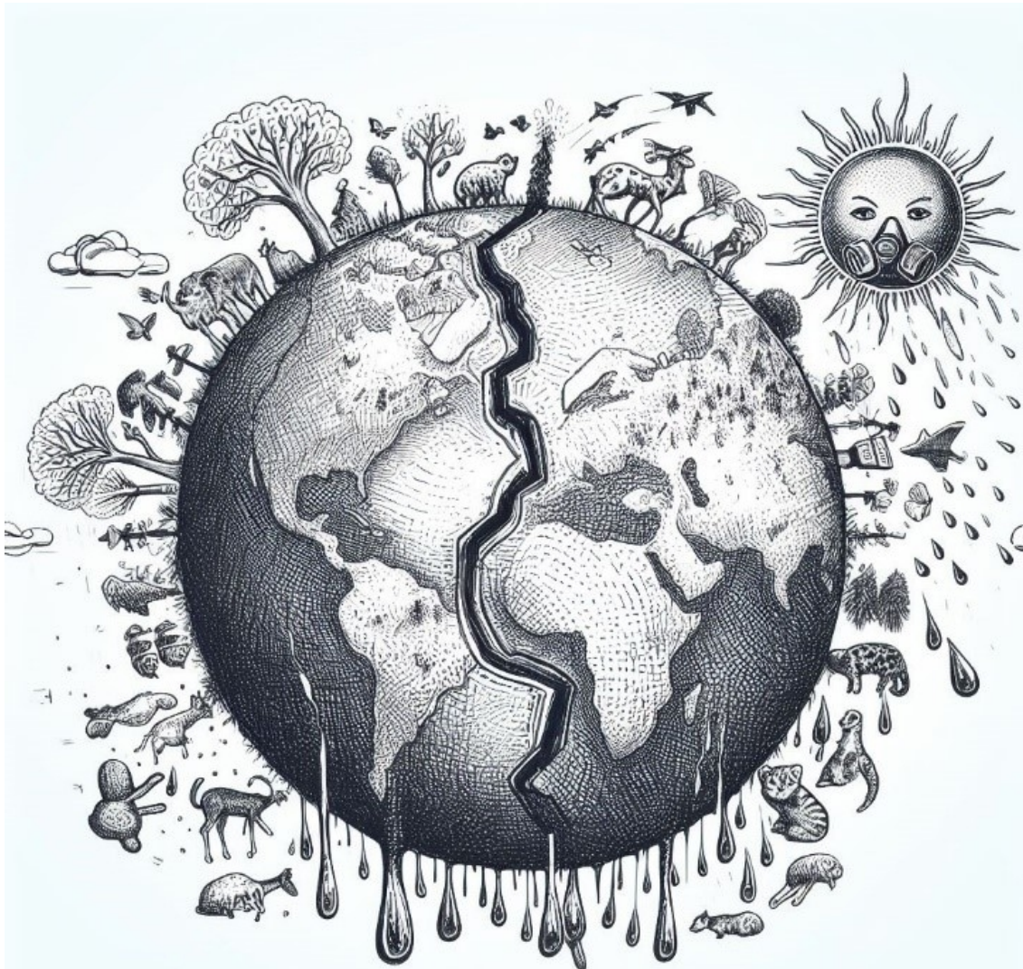
Biến đổi khí hậu ảnh hưởng đến môi sinh trái đất (nguồn: tác giả vẽ bằng AI)

Mặc dù hầu hết các nhà khoa học về chuyên ngành khí hậu đều đồng thuận rằng hoạt động của con người đang đẩy biến đổi khí hậu ngày càng trầm trọng hơn, nhưng một phần xã hội vẫn còn hoài nghi hoặc từ chối thực tế này. Cuộc tranh cãi xoay quanh sự nóng lên toàn cầu liên quan đến việc xác định liệu hiện tượng này có đang diễn ra và mức độ nghiêm trọng của nó tới đâu. Các câu hỏi còn liên quan đến nguyên nhân gây ra biến đổi khí hậu, cũng như việc nên hay không nên thực hiện các biện pháp hạn chế và cách thực hiện chúng. Bài viết này tìm hiểu nguyên nhân, hậu quả và ý nghĩa của việc phủ nhận biến đổi khí hậu, nhấn mạnh tầm quan trọng của việc giải quyết vấn đề này vì lợi ích của hành tinh chúng ta và các thế hệ tương lai.