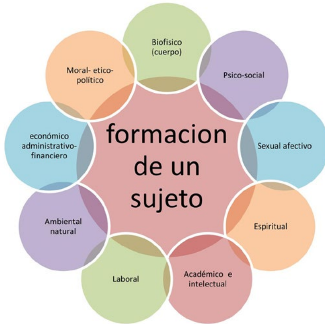
Figura 9 Formación de las Dimensiones del ser humano.