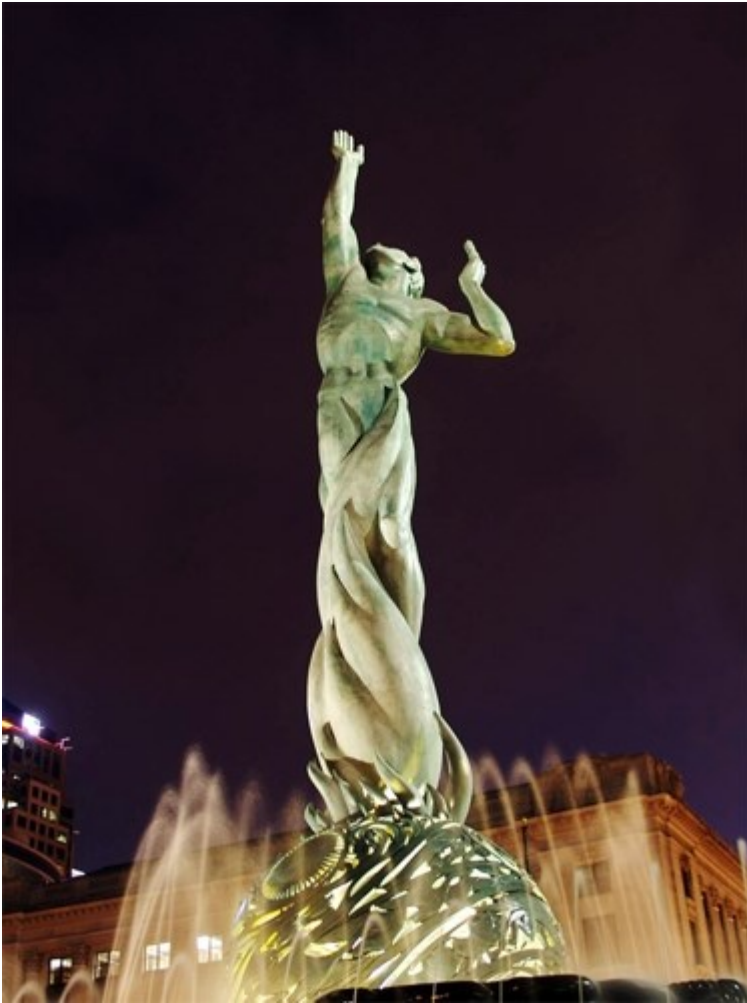
(Fântâna vieții eterne)

Nemurirea este viața veșnică, capacitatea de a trăi pentru totdeauna. Formele biologice au limitări inerente pe care intervențiile medicale sau de inginerie nu le pot depăși. Selecția naturală a dezvoltat nemurirea biologică la cel puțin o specie, meduzele Turritopsis dohrnii .