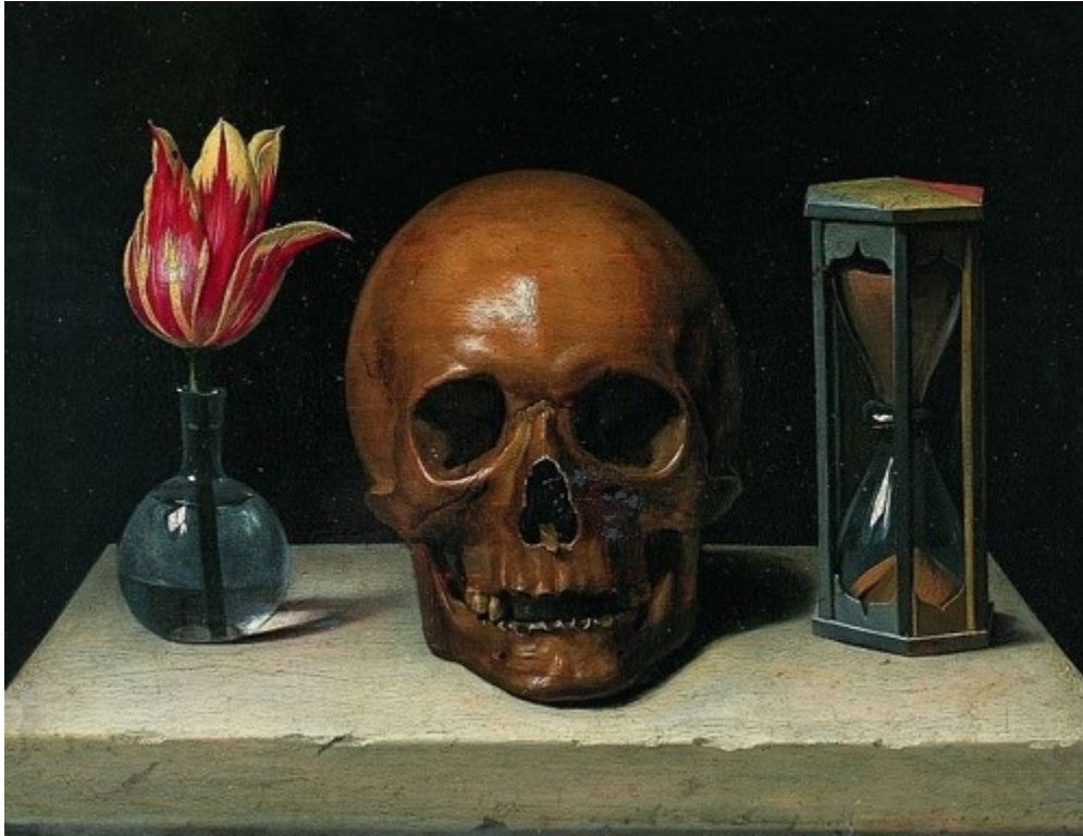
(O floare, un craniu și un stand de clepsidră pentru viață, moarte și timp, în această pictură din secolul 17 a lui Philippe de Champaigne)

Conceptul de moarte este un element-cheie al înțelegerii umane a acestui fenomen. Există mai multe abordări științifice ale conceptului. De exemplu, moartea cerebrală, așa cum se practică în domeniul științei medicale, definește moartea ca un moment în timp în care activitatea creierului încetează.