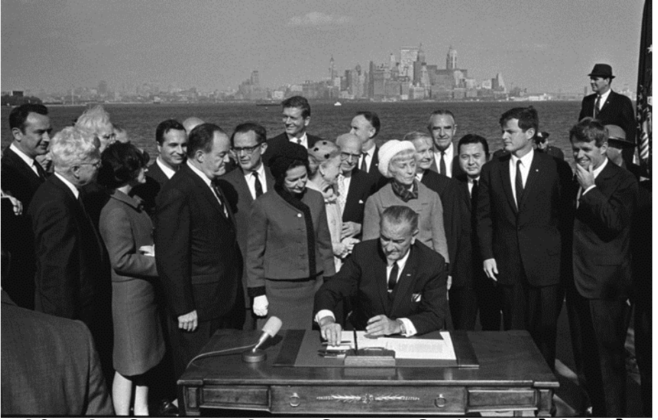
अमेरिका के इतिहास में सबसे दुखद दिन। राष्ट्रपति जॉनसन, 2 कैनेडी और पूर्व राष्ट्रपति ह्वर के साथ, मेक्सिको के लिए अमेरिका देता है - अक्टूबर 3rd 1965